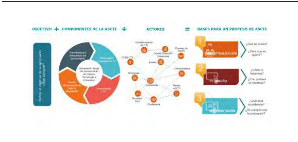
FIGURA 1. Modelo de apropiación social de la ciencia y la tecnología