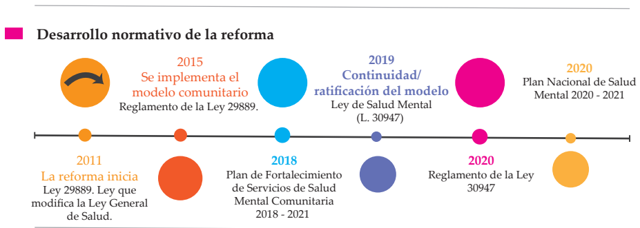
Figura 1 Desarrollo Normativo de la Reforma de Salud Mental en el Perú

de la sociedad civil, incorporó elementos importantes para comprender la salud mental como un asunto de derechos humanos. Así, se incorporaron conceptos como los determinantes sociales de la salud, el empoderamiento comunitario, los entornos saludables y los procesos de desinstitucionalización. El reglamento de la ley tuvo un proceso de consulta más amplio que permitió que las organizaciones hicieran incidencia sobre la inclusión de temas críticos como la planificación anticipada de decisiones en situaciones de crisis y la incorporación de expertos comunitarios en los servicios (Escuela Nacional de Salud Pública, 2020).