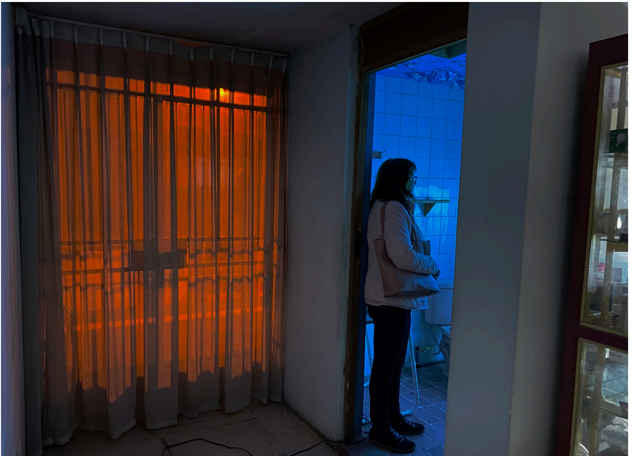
FIGURA 2 Pacheco, S. (2021). Al borde de las cosas [instalación]. Arequipa