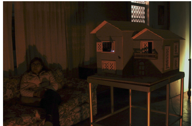
FIGURA 6 Pacheco, S. (2021). Sala de espera [Instalación de casa de madera y estructura metálica con proyección de video digital de 13'36"]

Es a través de estas teorías y sus posibilidades estéticas que introduzco también el concepto de la liminalidad como otro pilar fundamental para abordar la vejez, el cual —al igual que lo unheimlich— sirve para definir tanto al estado degenerativo de la senectud como condición fronteriza, a la casa como espacio de tránsito suspendido, y a los objetos como contenedores de memoria.