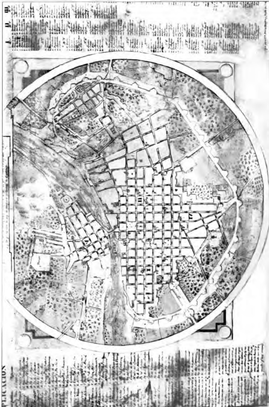
4 | Plano de Lima. Levantado por el S. D. Matías Maestro y Gregorio de la Rosa (ca. 1830) Se trata del primer plano republicano de Lima en el que se encuentran registradas las huellas de las primeras intervenciones urbanas realizadas por la República temprana. Encontrado en la Biblioteca Nacional del Perú por Leonardo Mattos-Cárdenas (1982).