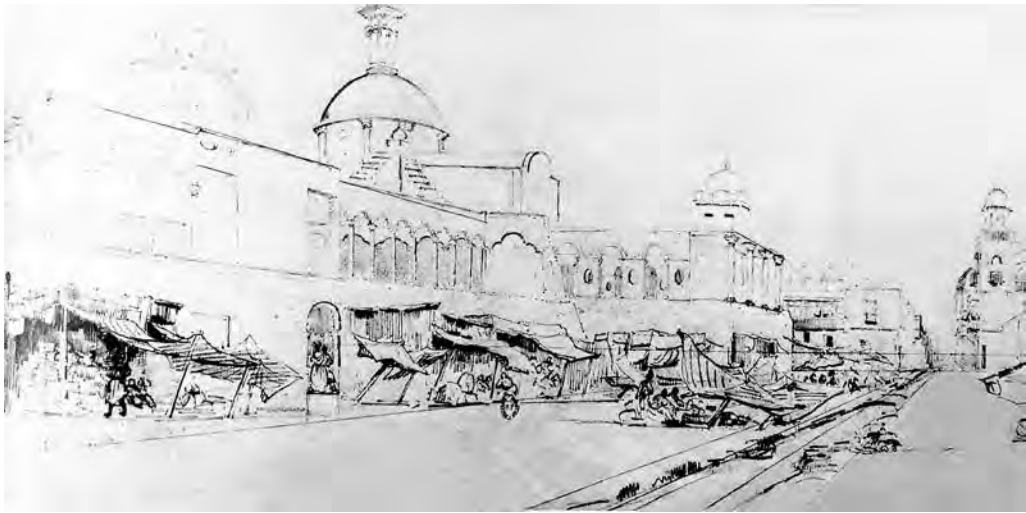
5 | Plazuela del Teatro. Área del proyecto de reforma de la calle del Teatro (1822) Dibujo de Leonce Angrand (1838).