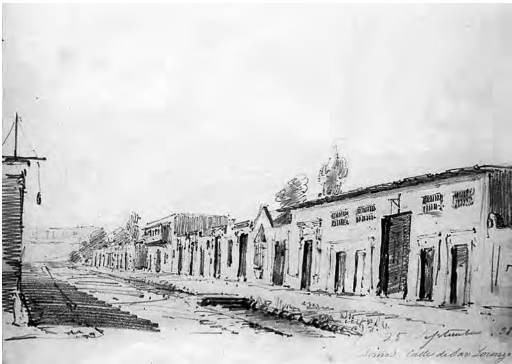
6 | Calle de San Lázaro. Rímac, Lima Dibujo de Leonce Angrand (25 de setiembre de 1838). Fuente: Angrand, 1972, p. 104.