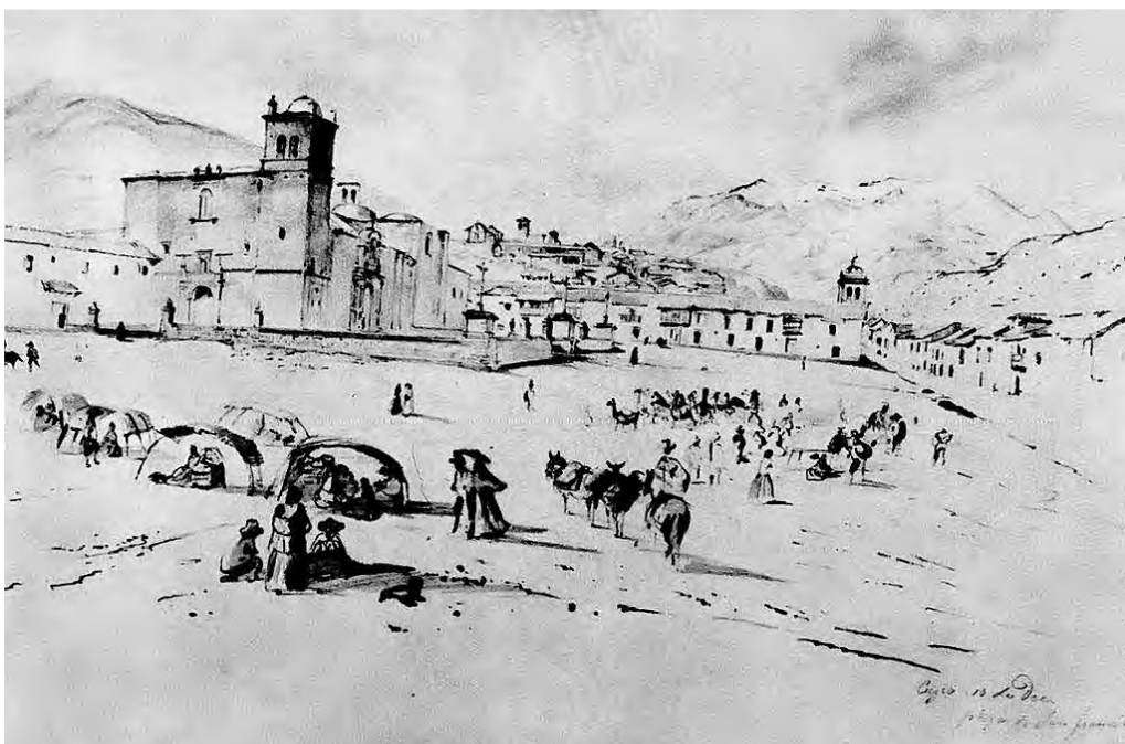
2 | Plaza San Francisco, Cusco Dibujo de Johann Moritz Rugendas (s.f., entre 1842-1845). Fuente: Rugendas, 1975, p. 225.