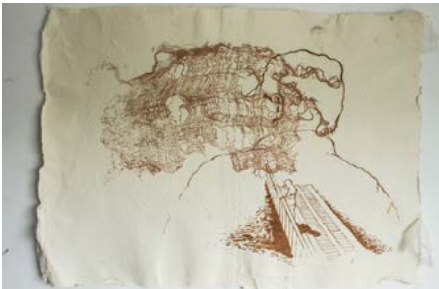
Figura 3. Kristel Melgarejo, Puente de memoria (serigrafía sobre papel artesanal). 2019.