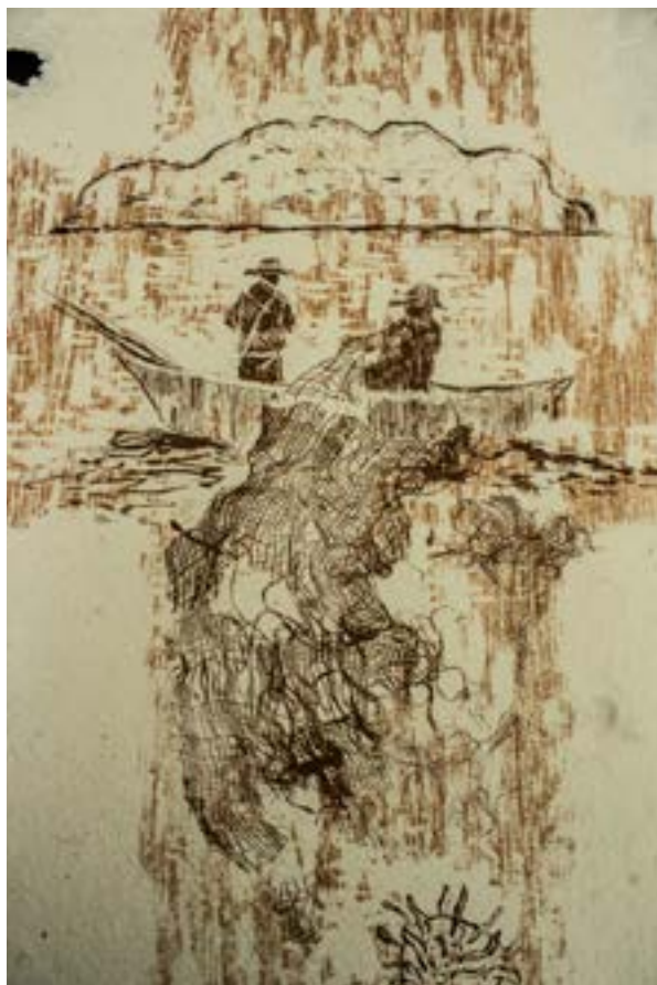
Figura 4. Kristel Melgarejo, Puente de memoria (serigrafía sobre papel artesanal). 2019.