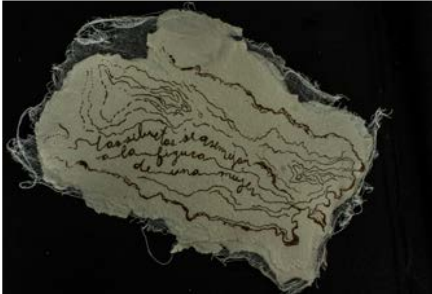
Figura 2. . Kristel Melgarejo, Cartografía San Lorenzo II (serigrafía sobre papel artesanal). 2019.