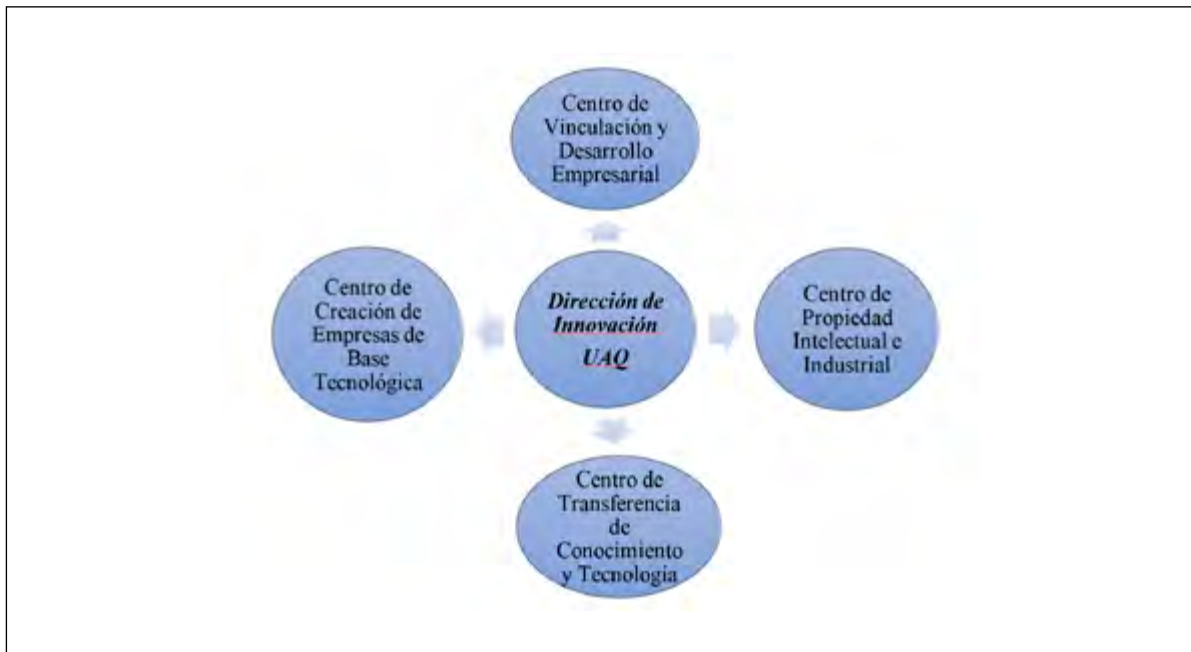
FIGURA 2. Estructura de la Dirección de Innovación-UAQ