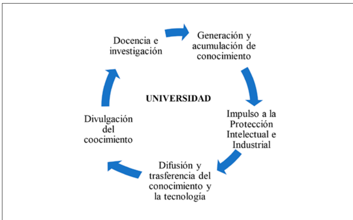
FIGURA 1. Acciones de la universidad a través la trasferencia tecnológica

Fuente: Pastrana, Alvarado y Muñoz (2022, p. 117)