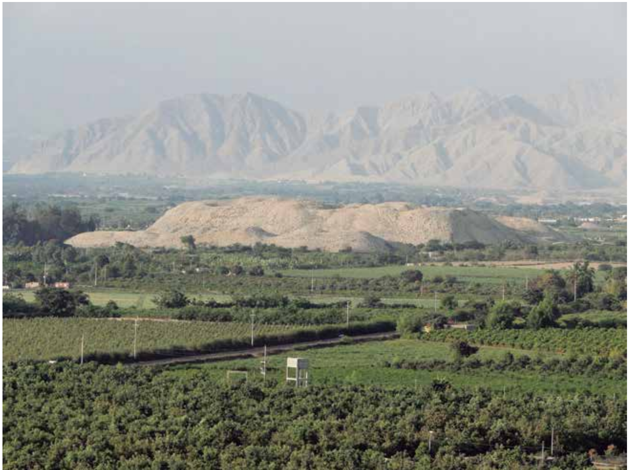
Vista panorámica del valle de Sechín en Casma. Al centro la monumental pirámide de Sechín Alto del período Formativo.