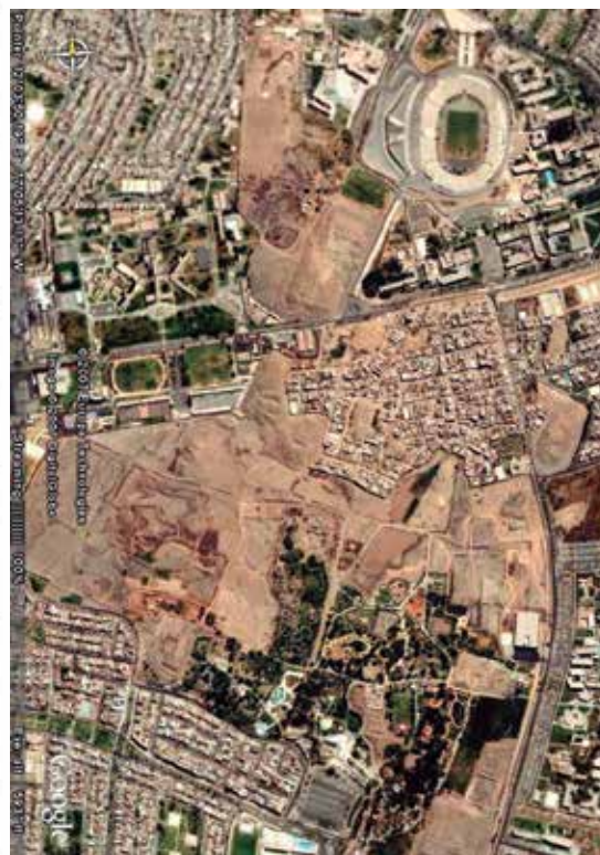
Plano general de la ciudad prehispánica de Maranga (Canziani 2009) y vista de su condición actual en la imagen satelital del 2006 (Google Earth).