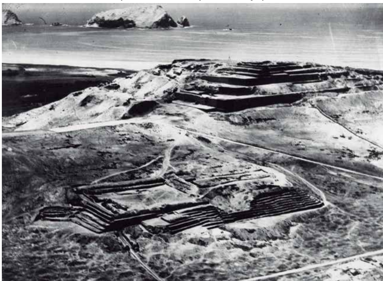
Vista aérea desde el norte del Templo Pintado y del Templo del Sol en proceso de restauración.

Esta situación territorial es crítica, ya que este tipo de intervenciones se realiza sin medir las consecuencias y en ausencia de una consecuente planificación y ordenamiento territorial, lo que afecta —muchas veces de forma irremediable— los recursos naturales y las condiciones productivas del territorio, pero también las calidades paisajísticas del mismo que se asocian a su identidad cultural, es decir a la gente que lo habita y que lo ha hecho habitable. En esta perspectiva de aproximación a la problemática territorial, encontramos múltiples coincidencias con las propuestas que han venido madurando las escuelas territorialistas europeas, las cuales postulan que “... el territorio constituye la construcción más densa que heredamos del trabajo de generaciones y es el patrimonio material más importante del que disponemos. Cómo preservar los caracteres específicos y la identidad, y cómo orientarlos hacia los nuevos usos que la sociedad demanda, es una cuestión abierta y materia tanto de conflicto como de proyecto” 1 .