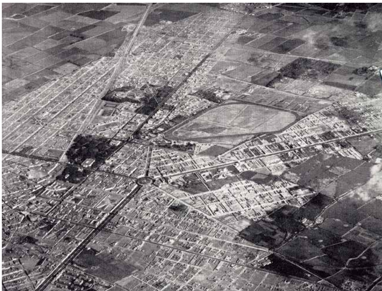
Vista aérea de la expansión de Lima hacia el sur del valle del Rímac, siguiendo los ejes del Paseo de la República y la avenida Arequipa. Al centro, el hipódromo de Santa Beatriz, el óvalo de la Plaza Bolognesi con el eje de la avenida Brasil hacia la derecha.