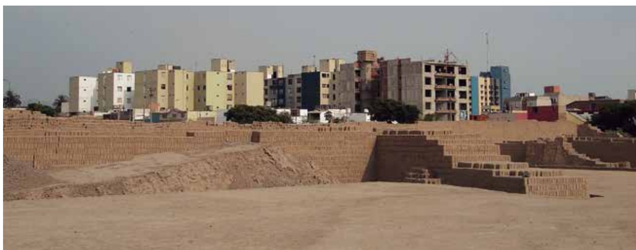
Huaca Pucllana. Vista del paisaje resultante del cerco urbano impuesto a los monumentos.