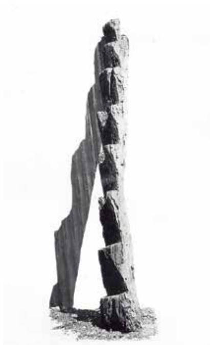
Pachacamac. Pieza escultórica de madera tallada en forma escalonada, de unos 2.60 m. de alto.

UHLE, Max. Pachacamac . Informe de la expedición peruana William Pepper de 1896. Primera edición: Universidad de Pensilvania, Filadelfia, 1903. Primera edición en castellano: COFIDE y Fondo Editorial de la Universidad Nacional Mayor de San Marcos, Lima. 2003 [1903]