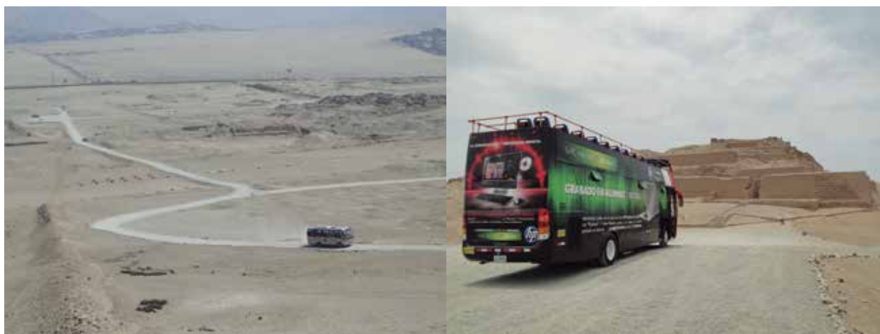
A la izquierda, las vías carrozables atravesando plazas y estructuras de Pachacamac. A la derecha, bus estacionado al pie del Templo del Sol y sobre la plataforma superior del Viejo templo de Pachacamac.

calzadas que permitan recorrer los flancos de sus murallas y las antiguas calles que articulaban sus distintos sectores. Además de remediar los trazos anteriores y mitigar los daños que han afectado los monumentos y el excepcional paisaje del lugar.