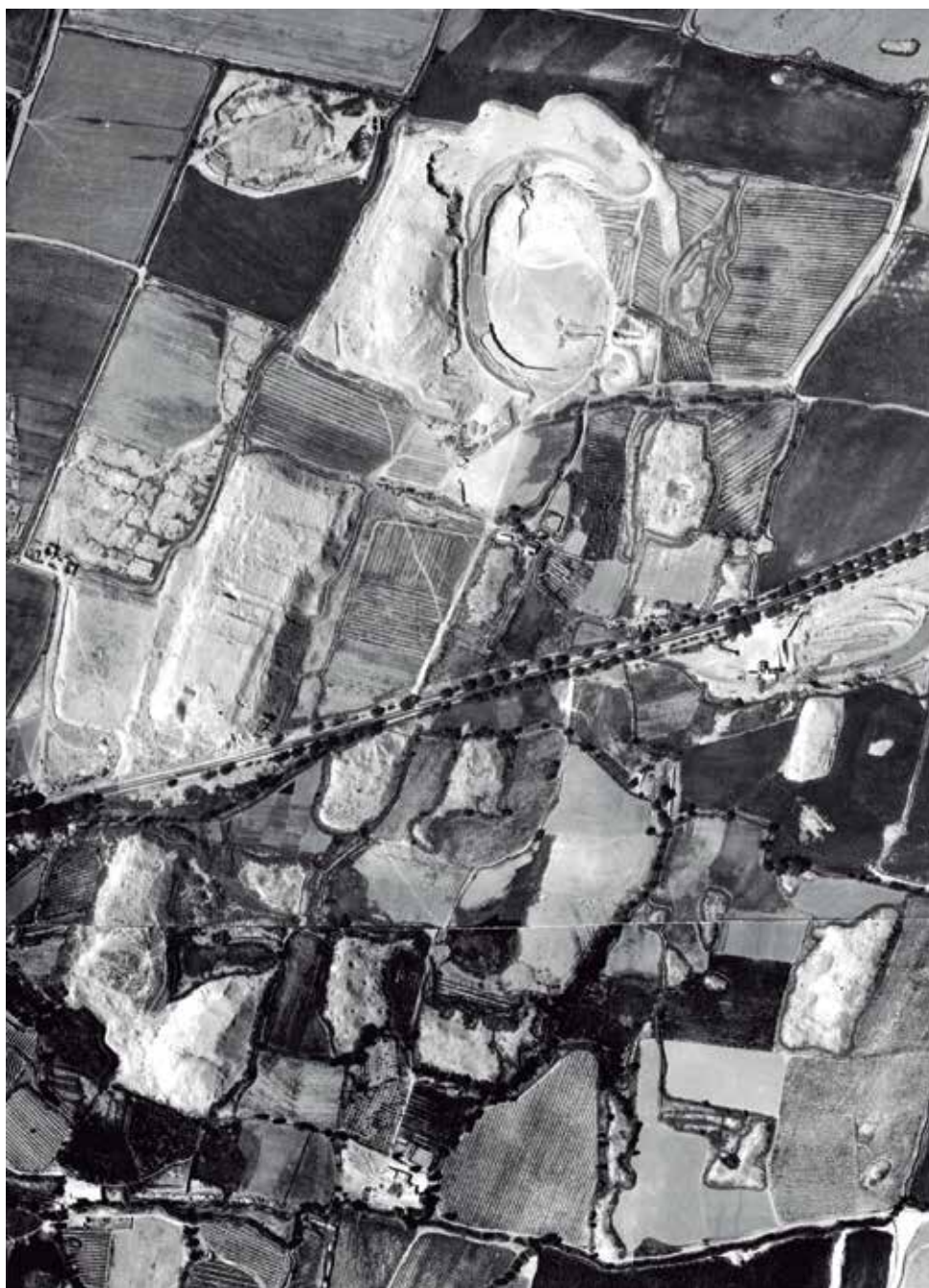
Vista aérea de la ciudad prehispánica de Maranga, atravesada por la avenida Venezuela. Arriba el proceso de destrucción de la Huaca Concha para la construcción de un estadio (SAN 1944).