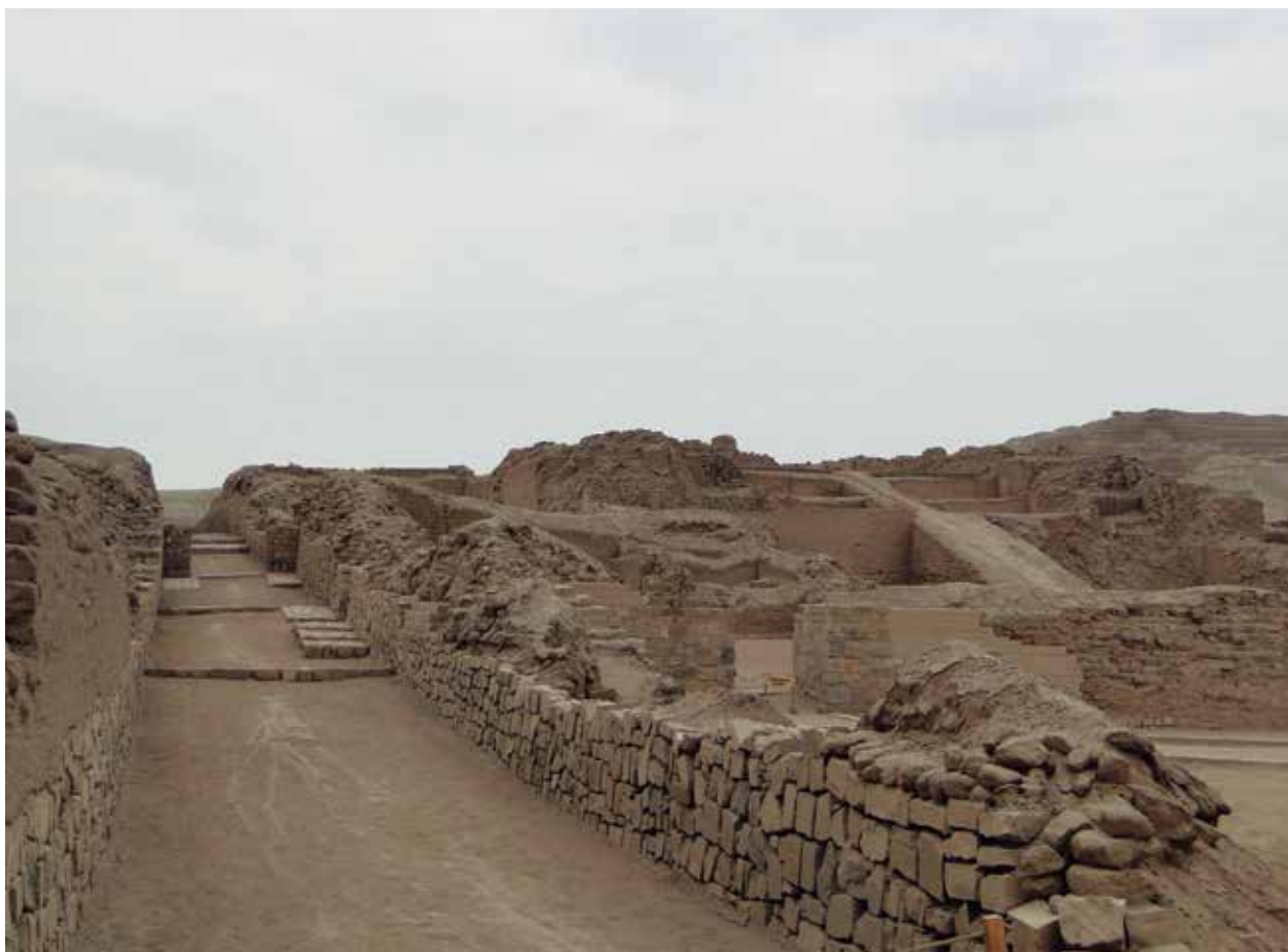
Vista de la calzada de la calle norte – sur, sobre la derecha el conjunto de la pirámide con rampa 1.

prehispánico. Fomentando la valoración de los monumentos y su entorno paisajístico, en su calidad de elementos identitarios y simbólicos, en cuanto espacios de uso social, creación artística y convocatoria cultural, en una trama urbana que Lima enraizó sobre el trazo preexistente de antiguos canales y el recorrido de viejos caminos que yacen bajo nuestros pies.