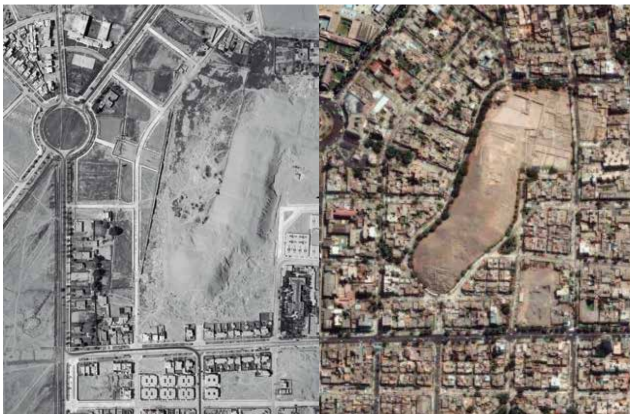
Vista aérea de la Huaca Pucllana en 1944 (SAN) y en la imagen satelital del 2006 (Google Earth).