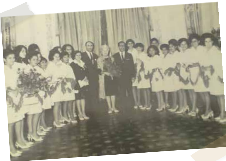
Graduación de la primera promoción de la Normal Experimental en la Municipalidad de Lima, apadrinada por el alcalde Luis Bedoya Reyes