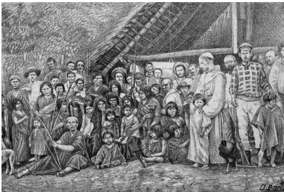
Figura 11. Chanchamayo. Expedición de colonos militares al Pichis. Grupo de colonos, salvajes, etcétera. Tomada de varias fotografías del señor Pérez, ingeniero de la expedición. Litografía de Paulino Tirado publicada en El Perú Ilustrado 103, 22 de abril de 1889, p. 1272.

De esta manera, el público podía imaginarse no solo lugares extraños sino también la forma y estilos de vivir de los colonos y de los nativos de la «montaña», de pueblos mineros, de las agrupaciones de pastores de la puna, etc., alcanzando, por primera vez, la posibilidad de reflexionar acerca del país por medio de sus gráficas, modelo de representación que repetirá el resto de la prensa nacional desde los primeros años del siglo XX. A modo de ilustración, recogemos el comentario de Giselle Freund: