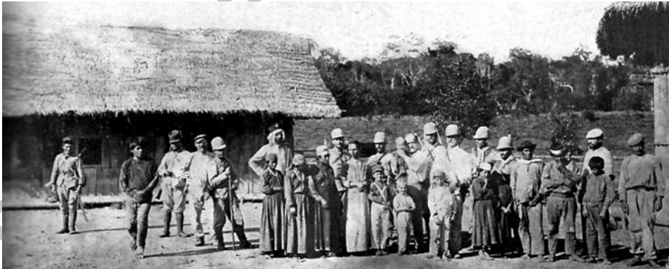
Figura 4. Vistas de la hacienda Frantzen en la zona de Chuchurras. Chuchurras, hacienda Frantzen ( Variedades , 1911).