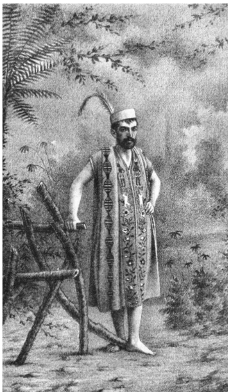
Figura 7. Imagen de Carlos Fry. Litografía de Evaristo San Cristóbal, 1889.