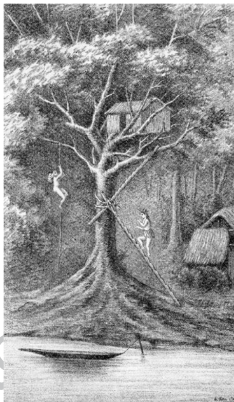
Figura 8. Montañas del Perú, habitación de los arahuacas. Litografía de Evaristo San Cristóbal, reproducida en Fry (1889) y en El Perú Ilustrado 112, 29 de junio de 1889.