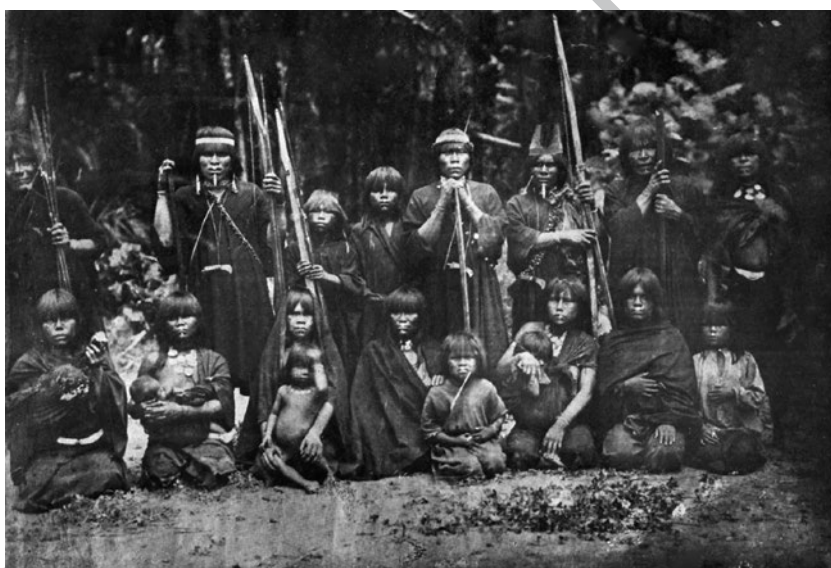
Figura 6. Grupo de conibos del Ucayali. Fotografía de Kroehle y Huebner, 1888 (Moss, 1909).

Por último, debemos destacar la preponderancia que alcanzaron las imágenes producidas por Kroehle y Huebner dentro de la prensa y opinión pública nacionales al momento de visualizar a los grupos indígenas amazónicos, manteniendo vigencia incluso hasta la década de 1940, cincuenta años luego del viaje de los fotógrafos por la selva peruana. Sus imágenes fueron constantemente reproducidas en distintos diarios y semanarios limeños y regionales como muestra del «conocimiento» adquirido sobre los grupos humanos establecidos en la región 6 .