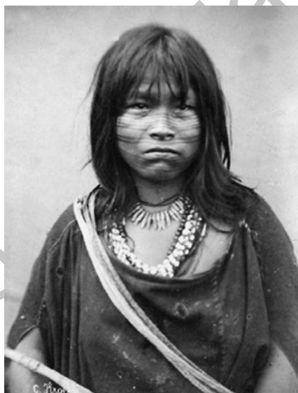
Figura 5. Retrato de una mujer shipiba del Ucayali. Fotografía de Kroehle y Huebner, 1888.

Nos encontramos frente a un trabajo pionero para la fotografía en el Perú, aun cuando, para la época, se conoce la existencia de ciertos registros elaborados por exploradores y etnógrafos, algunos de los cuales realizaron las primeras fotografías tipológicas de indígenas amazónicos. El trabajo de Kroehle y Huebner trasciende la obra de sus antecesores por el interés en recopilar material visual antes que en tomar notas y realizar descripciones de los sujetos observados, por el trato directo que tuvieron con las poblaciones indígenas asentadas en las márgenes de los ríos recorridos —acción necesaria para poder capturar las imágenes fotográficas—, por el tipo de público que tuvo acceso al consumo de este material visual y por la prolongada exposición que alcanzaron sus imágenes en la escena nacional, llegando a ser referentes obligatorios al momento de visualizar al indígena y al territorio amazónico peruano hasta mediados del siglo XX.