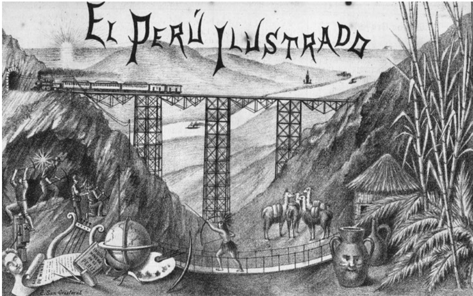
Figura 9. Portada de El Perú Ilustrado . Litografía de Evaristo San Cristóbal, 1887.