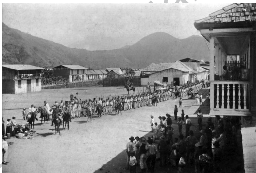
Figura 2. Expedición del coronel Yessup a su paso por La Merced, 1896.

Estos planes fueron desarrollados, de diversa manera, mediante la colonización con extranjeros y la ejecución de proyectos viales de penetración amazónica —entre los que se incluía el tan añorado sueño del ferrocarril al Amazonas—, al tiempo que las regiones se hacían más activas y vigorosas por la dinámica del comercio y la «civilización» de los salvajes. Dentro de estos planes, el grabado, la litografía y, posteriormente, la fotografía cumplieron un rol destacado, haciendo referencia al interés por conocer y desarrollar mecanismos efectivos de control del territorio y de divulgación entre la opinión pública urbana de los avances dentro del proyecto de dominio del espacio interior 2 . En la medida en que el Perú moderno va dominando y haciendo suyo el territorio para el aprovechamiento de los recursos y la ampliación del comercio, se hace imprescindible someter a la población indígena asentada en la región. Es necesario reflotar la actividad civilizadora con el fin de hacer de aquellos «indios indómitos e infieles» piezas fundamentales en el futuro progreso del comercio y demás actividades productivas en la región.