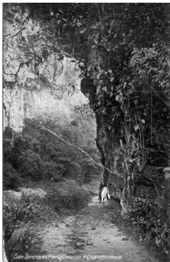
Figura 1. San Lorenzo, Perú, camino a Chanchamayo. Postal editada por Polack Schneider, de una fotografía original de Carlos Meyer tomada a fines del siglo XIX.

Dentro de estas destaca una serie de postales dedicadas al proceso de «conquista» de la «montaña» por medio de la vía del Pichis, primer proyecto transoceánico desarrollado por el Estado republicano peruano, iniciado en la última década del siglo XIX. Esta vía fue la materialización de una serie de intereses dirigidos sobre la Amazonía y de la «necesidad impostergable» de anexar su territorio al proyecto nacional positivista. En la práctica se trataba de un camino de herradura, con una extensión de unos 120 kilómetros de longitud, que unía el pueblo de San Luis de Shuaro en Chanchamayo —antigua misión franciscana y, para la época, límite de la colonización— con el río Pichis, en la selva de Pasco, desde donde, según varios informes de viajeros, científicos y exploradores, la cuenca del Amazonas se hacía navegable y permitía alcanzar Iquitos por medio de embarcaciones fluviales.