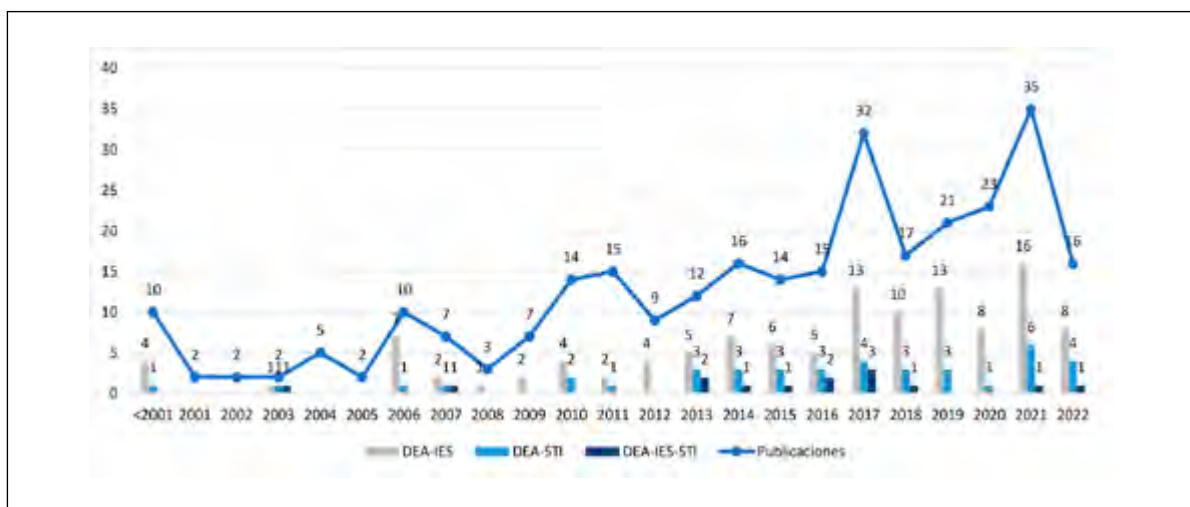
FIGURA 2. Comportamiento de las publicaciones indexadas en Scopus

El crecimiento de las publicaciones también se puede asociar a las definidas en las agrupaciones del tema 1 y 2, y al comportamiento del tema 3.