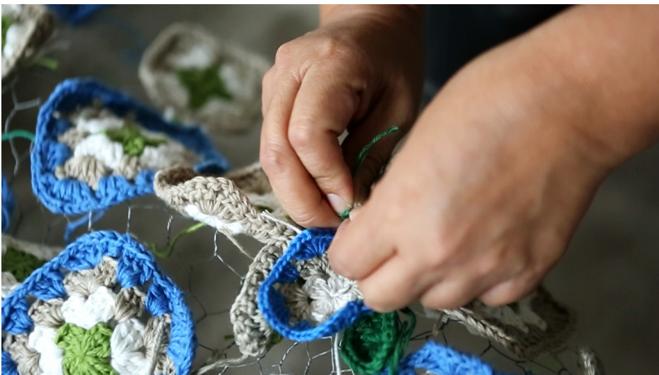
FIGURAS 5-7 Ponte, M. (2022). Aquí, en todas partes, siempre [stills de video]