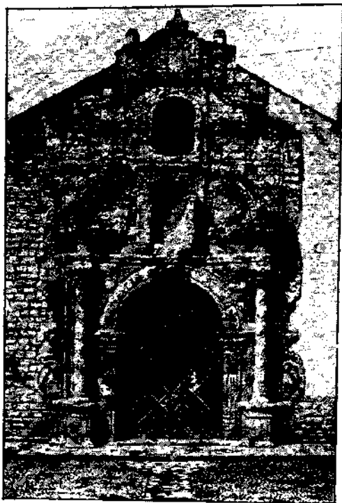
IGLESIA DE SANTO DOMINGO DE LA CIUDAD DE HUANCAVELICA Portada principal (cortesía del arquitecto José Correa Orbegoso).