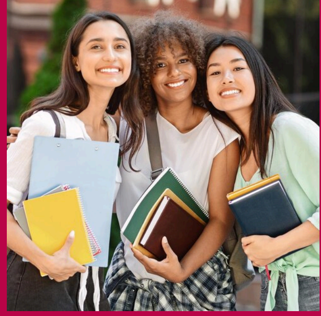
Figura 1 Nota: Adaptado de Representación social de niños, niñas y adolescentes de la Universidad Nacional de San Marcos, 2019. Recuperado de https://www.unmsm.edu.pe/boletines/boletines-de-actualidad/representacion-social-de-ninos-ninas-y-adolescentes

Esta investigación abordó las creencias sobre la maternidad en mujeres universitarias de Lima Metropolitana, destacando cuatro temas principales: la influencia de factores socioculturales, el apoyo social, los retos que enfrenta la maternidad, y su potencial para el crecimiento personal. Aunque se identificaron aspectos positivos de la maternidad, predominan las percepciones de sus dificultades.