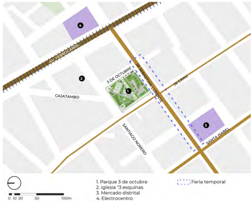
FIGURA 8 Plano de ubicación del parque 3 de Octubre, Huancayo. El mercado, la feria y Electrocentro son los atractores para un gran flujo de personas. Elaboración propia, 2021.