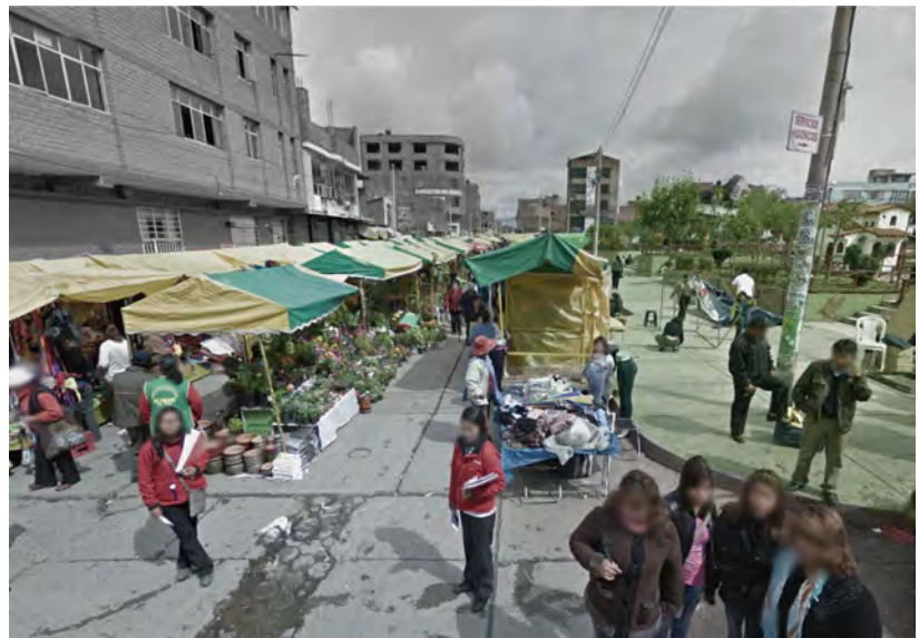
FIGURA 9 Vista hacia el jirón Sebastián Lorente. No existe ningún espacio que complemente las actividades del parque. Además, este se encuentra cerrado al flujo comercial, mientras que la feria se mantiene en la calle, obstaculizando el tránsito vehicular.