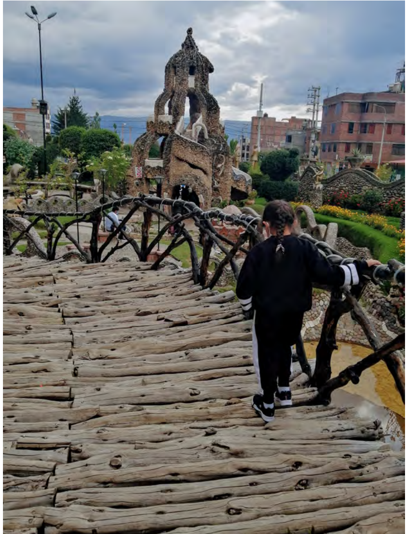
FIGURA 11 Vista desde el puente principal del Parque de la Identidad Wanka. Los troncos hacen complicado cruzar el puente. En la parte posterior se observa la zona de niños junto al castillo, de acceso solo para ellos debido a la altura de entrepisos.