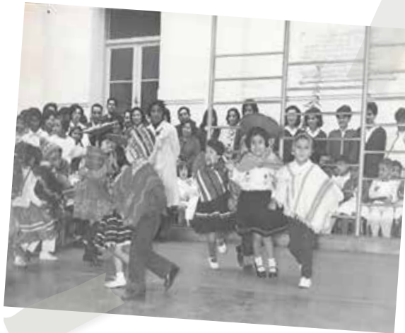
El patio del Jardín de la Infancia N°1 era el escenario para las actuaciones y celebraciones según el calendario