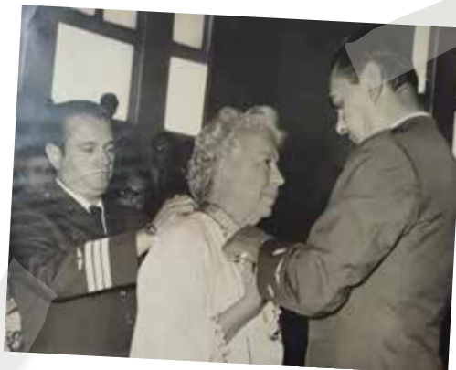
Emilia Barcia Boniffatti recibe la condecoración de las Palmas Magisteriales en el Grado de Comendador

A lo largo de su trayectoria, Emilia Barcia Boniffatti recibió diversos reconocimientos por su liderazgo y gestión pionera en la educación preescolar y en la formación de maestras de la especialidad. Entre ellos destacan las Palmas Magisteriales en el grado de Comendador (5 de enero de 1964) y la Orden del Sol en el grado de Gran oficial (26 de octubre de 1981).