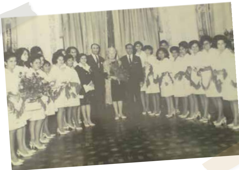
Graduación de la primera promoción de la Normal Experimental en la Municipalidad de Lima, apadrinada por el alcalde Luis Bedoya Reyes

En diciembre de ese mismo año, egresó la primera promoción de la Normal Urbana Experimental, conformada por 40 estudiantes, quienes eligieron el nombre “Emilia Barcia Boniffatti” para su promoción. La formación continuó a lo largo de los años, contribuyendo a la consolidación de la educación de la primera infancia en nuestro país, siempre bajo el lema de San Francisco de Sales (1609): “Todo por Amor Nada por Fuerza”. Posteriormente, otras instituciones de educación superior incorporaron la formación de maestras de educación infantil como parte de su oferta educativa.