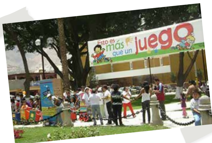
Registro fotográfico de la campaña “Esto es más que un juego” (MINEDU, 2010)