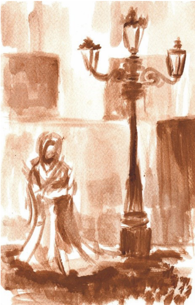
FIGURA 5 Chavez, G. (2018). Tapada sola [dibujo sobre papel]

Este modelo se presenta a principios del siglo XX, cuando el arte se desprendió del modelo académico debido a las consecuencias del pensamiento racionalista que impactó en la pérdida de valores, empatía y honestidad causados por conflictos como las preguerras (Tejeda, 2019). Estos hechos hicieron que los artistas de la época se desligaran del enfoque academicista y propusieran nuevas corrientes artísticas que valoricen las emociones y los sentimientos e incluyeran nuevas técnicas y soportes (figuras 5 y 6).