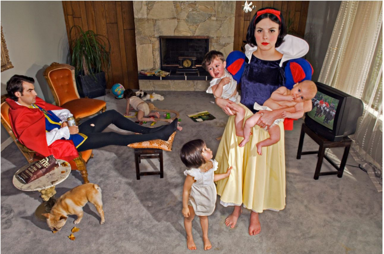
FIGURA 7 Goldstein, D. (2008). Blancanieves [fotografía]

Finalmente, es importante recalcar que los dos primeros enfoques han funcionado en su contexto; sin embargo, es necesario que amplíen su vínculo con otros enfoques. En ese sentido es importante que el docente acepte todos los enfoques como una herramienta para ampliar las mentalidades de los estudiantes y para evitar que se arraigue a uno solo.