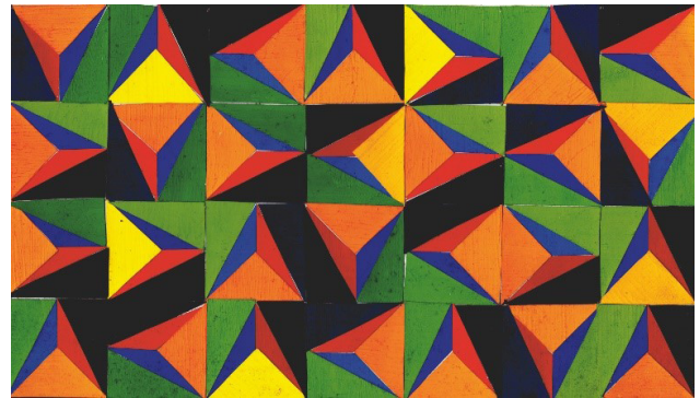
FIGURA 6 Chavez, G. (2015). Movimiento geométrico [collage]