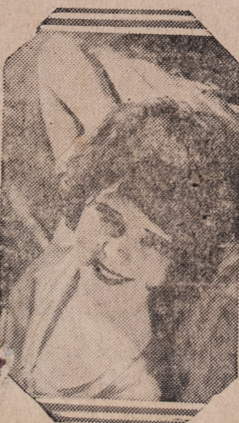
CLARA BOW In the Paramount Picture "Love Among the Millionaires"

des se agolpaban a su paso tratando de obtener una vislumbre la la famosa estrella, tanto que fué necesaria la intervención de la policía para regular el tráfico. La noticia de su reciente triunfo en "ALMA LIBRE" había precedido a Norma, mientras que el recuerdo de "LA DIVORCIADA" estaba todavía fresco en la memoria del público londinense.