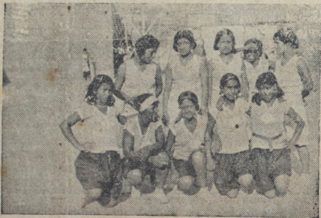
Teams de San Martín y Huamanga

A esta cruzada se asoció Francia hace más de 40 años, fomentando la práctica de saltar vallas. Para