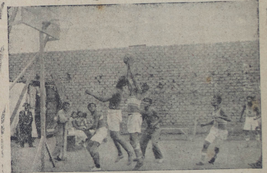
Escena del match de basket ball entre el Gastañeta y América Chorrillos