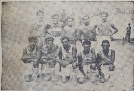
Los equipos de basket ball del Gastañeta y América Chorrillos

grabado, no encuentra dificultades, su ganado es de calidad y su sólo anuncio lleva gente a la plaza.