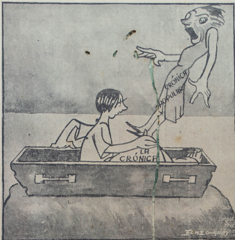
Fué un caso muy singular, un chantaje muy grosero el de "La Crónica Popular" que levantó un avispero.

La plata más segura es la que se gana con el sudor de la frente o los pies. Eso de querer ganarla fácil de un porrazo es fatal, contraproducente, no da resultados prácticos, y conocemos a muchos carreristas o perrieristas que siempre están sin un centavo en el bolsillo, lamentándose de su mala suerte, sin que por eso dejen de seguir empedernidos en el fa-