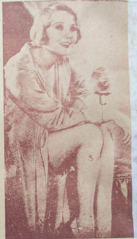
Dorothy Mackaill, en un momento de reposo y meditación