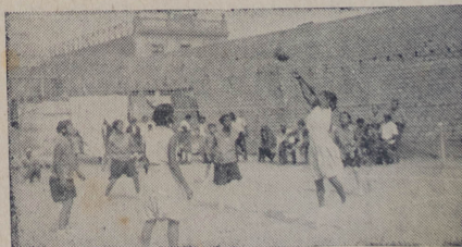
Escena del match del Textil Victoria y Minerva

Una de las cosas que me ha llamado más la atención durante esta temporada ha sido la gran variedad