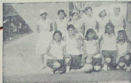
Jugadoras del Yankee y del Cóndor

Aunque el aspecto financiero se presentará tan poco satisfactorio, es en extremo halagador el hecho de que se pueda hablar elogiosamente de la calidad del juego. Existen unos cuantos descuentos que siempre se lamentan de que ya no se vean como solía hacerse hace años, pero a ellos van participantes activos en los partidos de football. Pero, como se dice en general, del fútbol los sports. A juicio de mí, esto lo mejor ha sucedido siempre. Por mi parte,