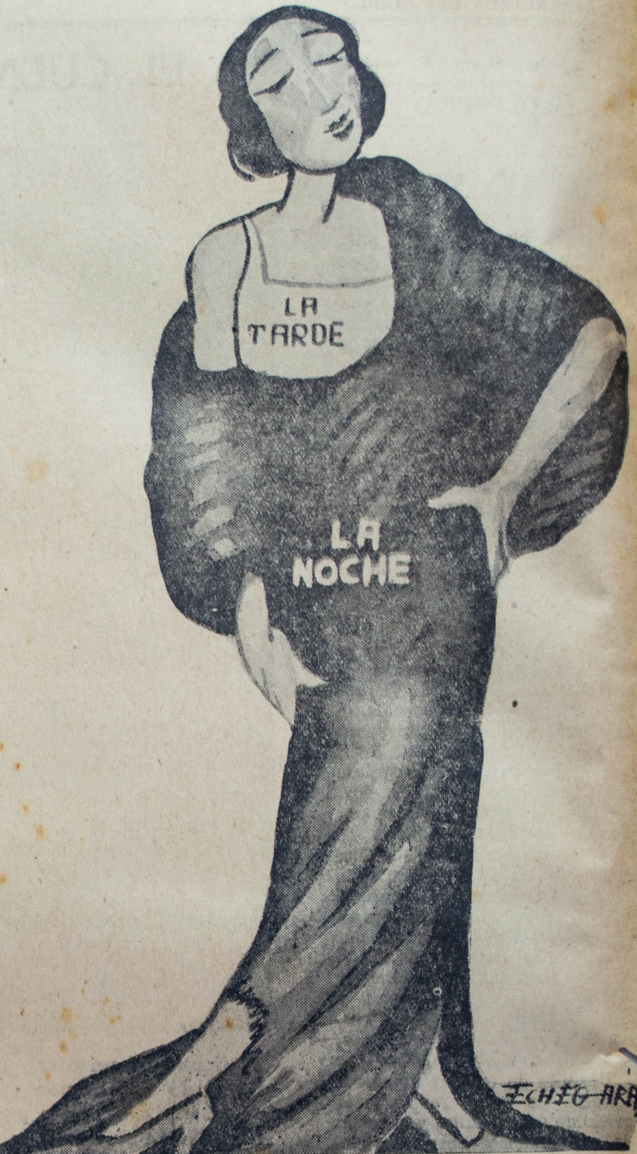
"La Tarde" era triste de noche salía, usando un disfraz que no le caía.

"El público estuvo bastante incorrecto, especialmente en sol. ¿Es que no sabemos perder? Al paso que vamos se hará imposible traer equipos extranjeros a Costa Rica. ¿Por qué no se ha observado de esta vez la misma conducta que se mantuvo en el "Hakoah"? Este equipo de nuestra cultura, de unidad y de esto