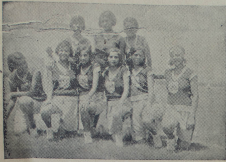
Equipo del Femenil Callao

Lo demas, es decir, el interés del match que es lo que principalmente preocupa al público, queda sujeto al entusiasmo y esfuerzos que desplieguen los jugadores por complacerlo, los que creemos no han de omitir.