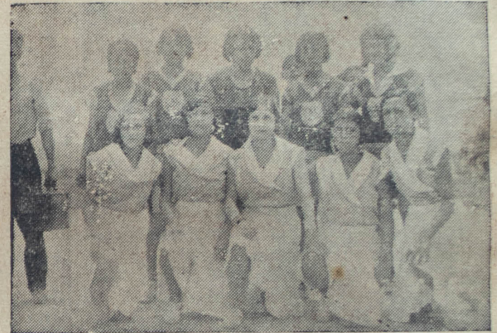
Los equipos del Athletic Femenil y Yankee

Cumplimos, por nuestra parte, llamar la atención sobre este a