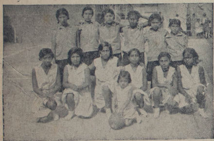
Los equipos Textil Victoria y Minerva

que existe en las tácticas que emplean los principales clubs. Con el fin de explicarme más claramente citaré algunos ejemplos dados por los equipos de la primera división de la Liga. Los jugadores de Everton adoptan el plan de ataque a la moda antigua. Juegan con la concisión de que la mejor defensa la