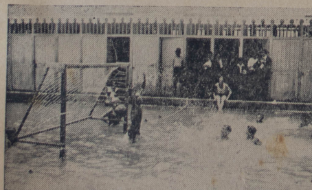
Escena del match de waterpolo en los baños del Comercio y en la fiesta de la Y. M. C. A.

En la Segunda División, Wolverhampton Wanderers y Leeds United son los equipos que más prometen. Los Wanderers no juegan en forma científica ni mucho menos, pero forman un team fuerte y poderoso, y están actuando con tanto entusiasmo, que es muy posible que figuren a la cabeza de su división. Charlton y Bristol City son los más probables candidatos para pasar de la Segunda a la Tercera División.