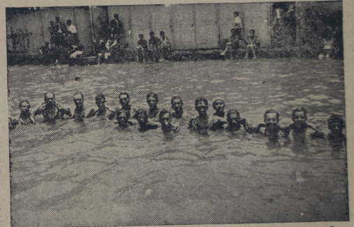
Nadadores que tomaron parte en el festival realizado en los baños del Comercio

fuerte equipo que puede enfrentarse. le por ahora, porque aparte de que lleva la moral muy alta por sus dos triunfos, se sabe el espíritu y la decisión que los chalacos suelen aportar en defensa de la representación que invisten, lo que más de una vez ha constituido el factor de sus éxitos.