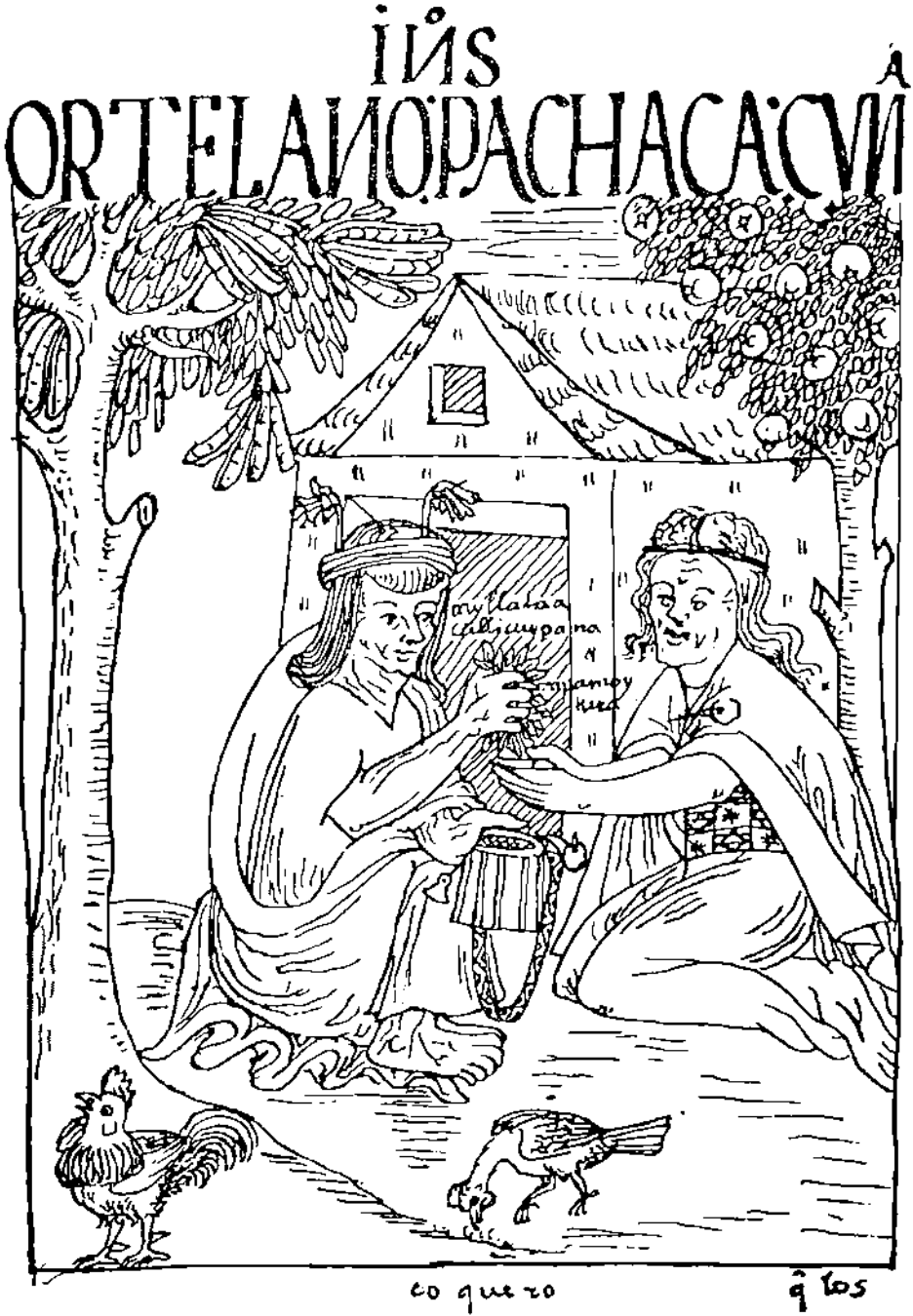
fig. 3: (pág. 865). Cempesinos consumiendo coca. Uno de ellos pide y el otro ofrece para que "acullique".