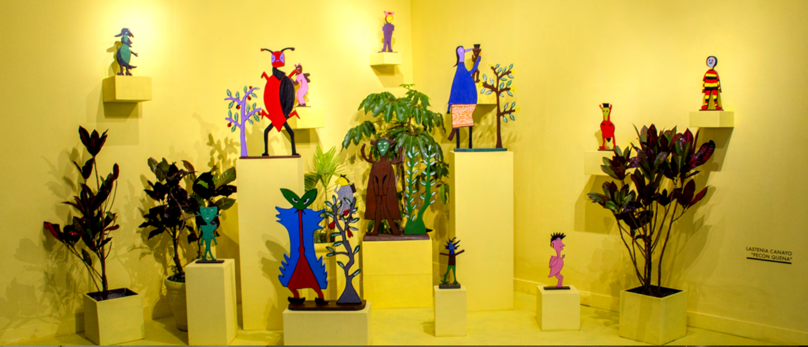
LASTENIA CANAYO "PECON QUENA"