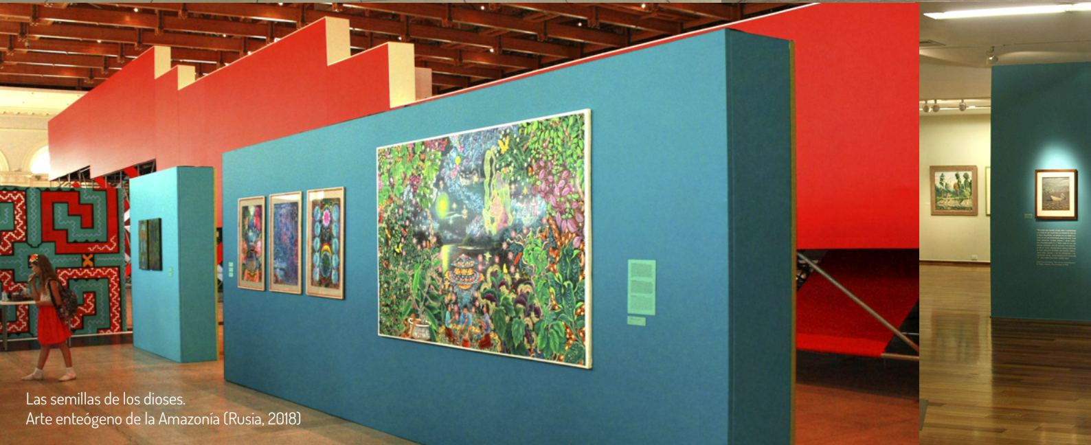
Las semillas de los dioses. Arte enteógeno de la Amazonía (Rusia, 2018)