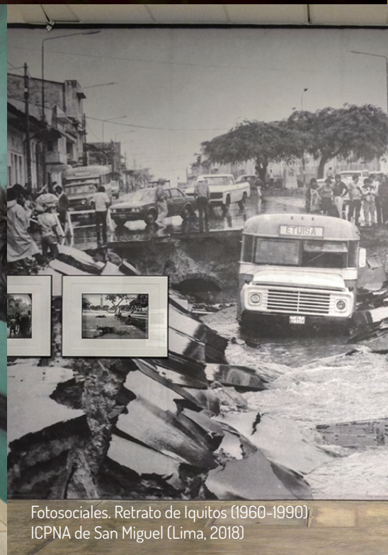
Fotosociales. Retrato de Iquitos (1960-1990) ICPNA de San Miguel (Lima, 2018)