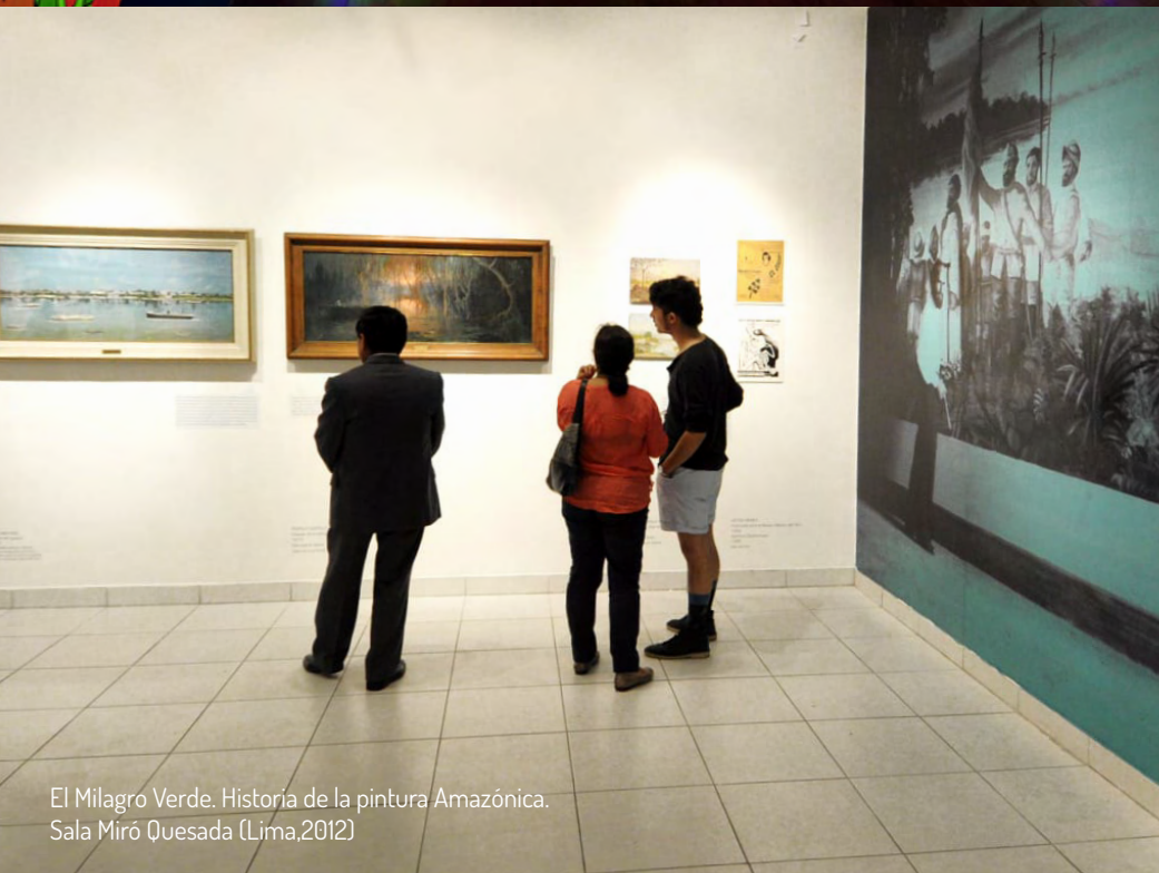
El Milagro Verde. Historia de la pintura Amazónica. Sala Miró Quesada (Lima, 2012)