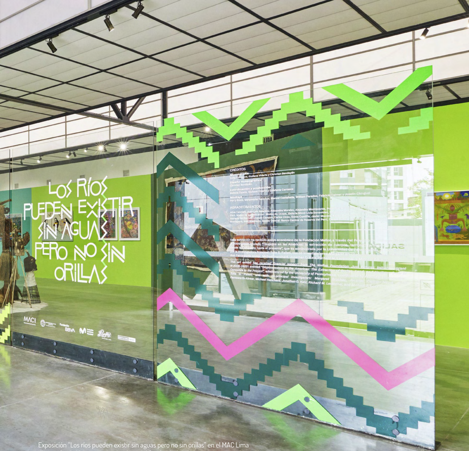
Exposición "Los ríos pueden existir sin aguas pero no sin orillas" en el MAC Lima