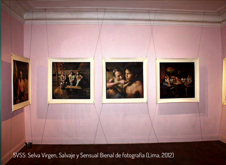
SVSS: Selva Virgen, Salvaje y Sensual Bienal de fotografía (Lima, 2012)