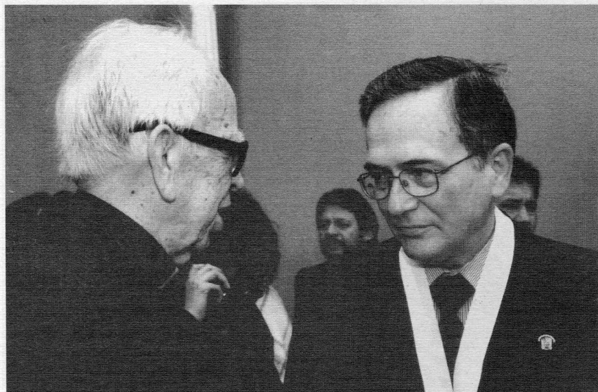
Padre Felipe Mac Gregor, S.J. y Dr. Henry Pease García San Miguel, 29 de setiembre del 2003.