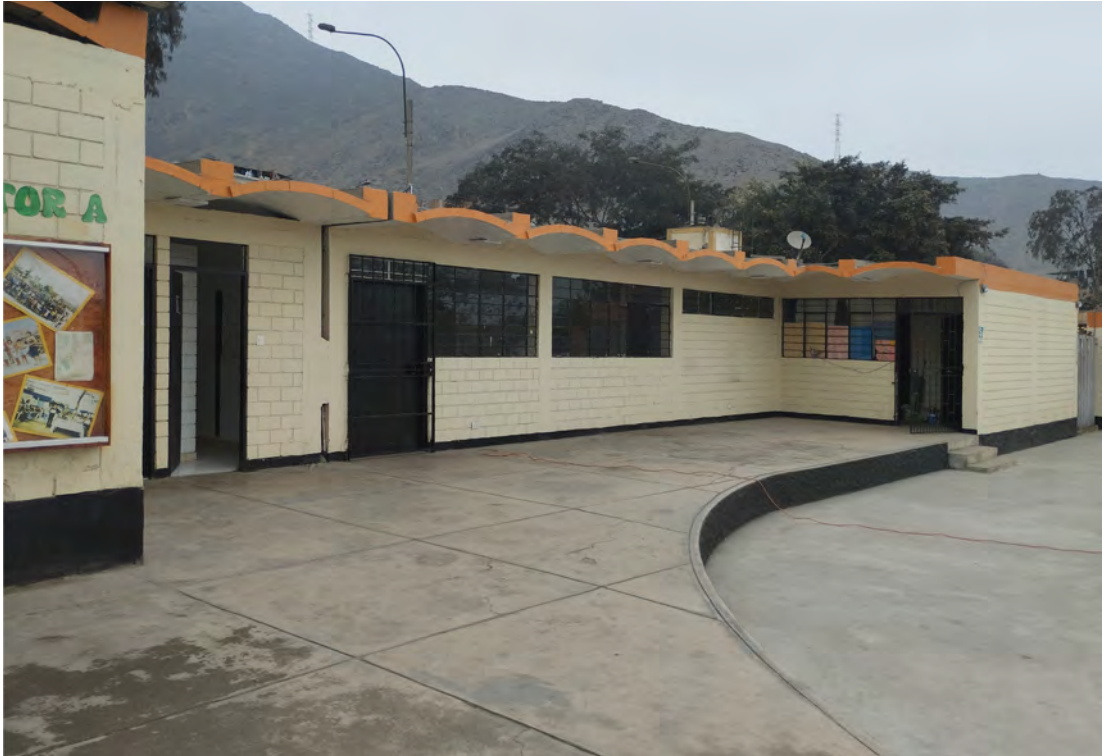
FIGURA 13 Biblioteca Helen Keller, SJL, Lima.

En el distrito de San Juan de Lurigancho no abundan los espacios culturales; sin embargo, se pueden encontrar algunos que promueven actividades educativas. Uno de ellos es la Biblioteca Comunal Helen Keller, de la comunidad de Mangamarca. Esta biblioteca, que funciona desde 1983, ubicada entre el local comunal y un colegio de educación inicial, se logró construir gracias a donaciones y por la iniciativa de los mismos pobladores (TV Perú, 2018). La biblioteca cuenta con un amplio salón para la lectura y espacios complementarios, como una pequeña oficina para la bibliotecaria. La estructura se compone de un techo abovedado de ladrillos y columnas de concreto armado. La elección del techo abovedado, en lugar del aligerado de concreto que normalmente se emplea, sugiere la presencia de una persona especializada en construcción, o quizá de un arquitecto. Cabe tener en cuenta que la decisión de construir un techo abovedado de ladrillo disminuye el gasto en materiales (Figura 13 y 14).