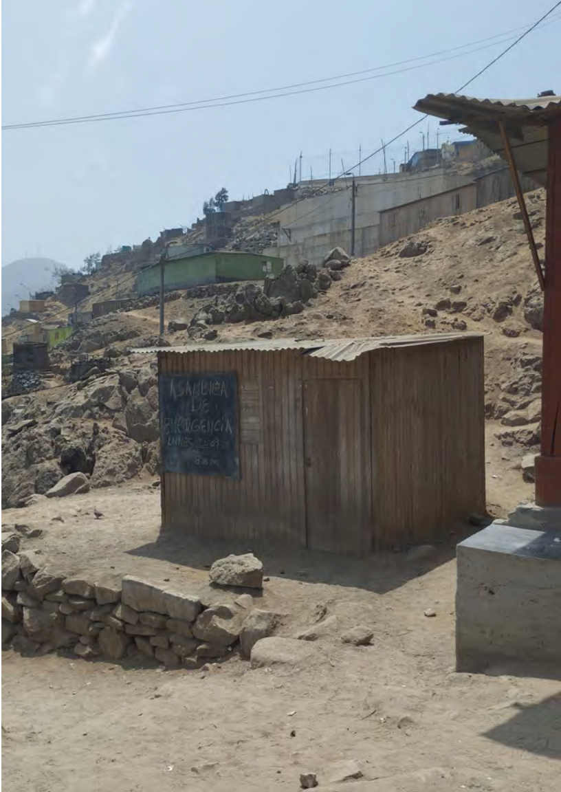
FIGURA 3 Pizarras para la organización en la agrupación familiar Biohuerto Paraíso, SJL, Lima. Fotografía: Yadhira Mendoza, 2022.