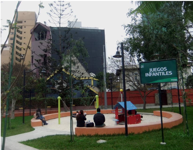
Figuras 3 y 4. San Isidro. Gestión municipal 2015-2018. Plaza Bollar: intervenciones en el espacio público.