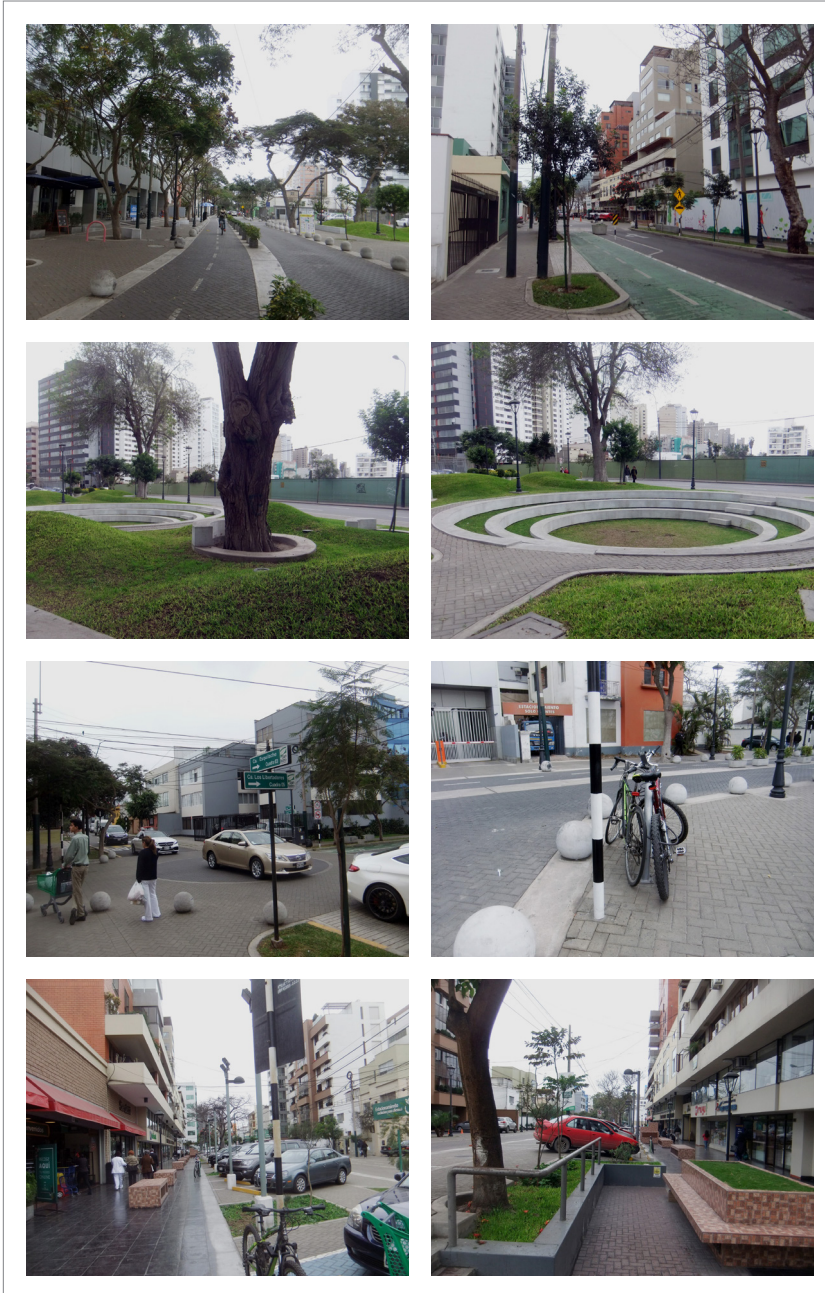
Figura 7. San Isidro. Gestión municipal 2015-2018. Remodelación de la calle Los Libertadores. Intervenciones en los espacios públicos.