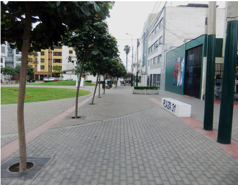
Figuras 5 y 6. San Isidro. Gestión municipal 2015-2018. Plaza 31: intervenciones en el espacio público.