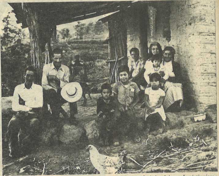
La Iglesia toma conciencia de la contradicción entre la injusticia y el cristianismo en nuestra sociedad. La Iglesia quiere dar testimonio del Reino entregándose a los más pobres.

Las repercusiones de un llamado tan vigoroso no se harían esperar. En particular, para el tema que nos ocupa, será como un gran impulso que se añade a la motivación de reforma ya existente. El Papa había dicho su palabra. Era preciso ahora que la Iglesia Latinoamericana-