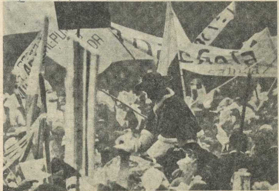
El Papa Pablo VI, el primero en pisar tierra latinoamericana, llega a Bogotá.

Entre los primeros había 6 grupos: a) Los Presidentes de las Conferencias Episcopales Nacionales; b) los obispos representantes de sus respectivas conferencias a razón de un delegado por cada 25 obispos; c) el equipo "CELAM", es decir los tres miembros de la Presidencia, los delegados y sustitutos de las con-