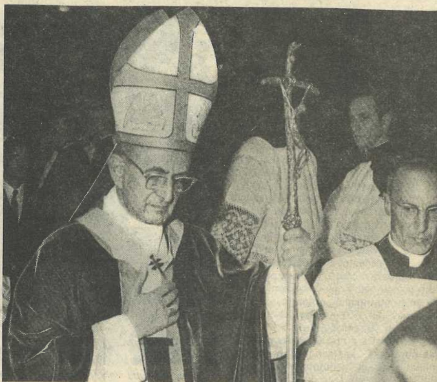
Pablo VI, desde antes de ser Papa, apoyó la constitución del CELAM.

En los textos de esos primeros momentos predomina, a nivel de análisis de la realidad, la perspectiva desarrollista. La parte de estudio del encuentro del Mar de Plata será característica sobre el particular. Se propone, en efecto, estudiar "la presencia activa de la Iglesia en el desarrollo y en la integración de América Latina" y, si bien se percibe que los problemas que sufren nues-