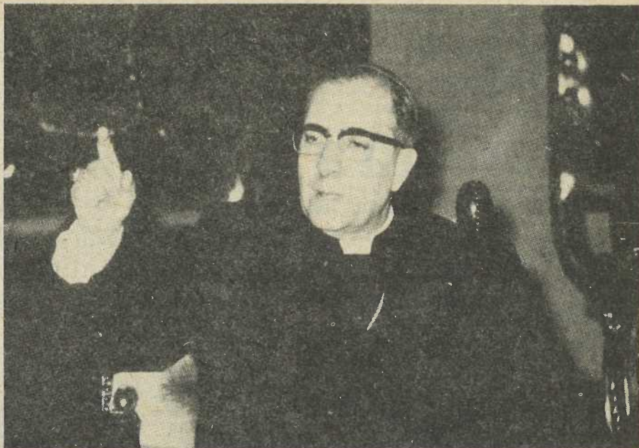
El Cardenal Landázuri, presidió la Conferencia de Medellín.

El Cardenal ubicó a continuación, en un valiente y bello discurso, el sentido y las preocupaciones de la Conferencia. Iniciaba así un evento que, desde muchos puntos de vista, se ha revelado en el transcurso de los años como un verdadero momento de gracia, como un paso salvífico del Señor en nuestra Iglesia y en nuestra América. De esa historia hemos vivido estos últimos quince años y ahora nos corresponde más que nunca ahondarla con la misma firmeza y fidelidad que tuvieron sus precursores.