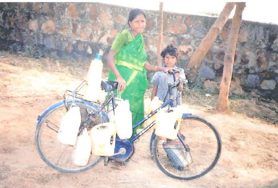
Trabajadora doméstica haciendo sus labores, como ir a buscar agua en la bicicleta.

El aumento de la urbanización está dando lugar a cambios en el estilo de vida de las familias. En las familias tradicionales extendidas, siempre había alguien que se quedaba en casa, especialmente las mujeres. Así que algunas personas salían hacia el trabajo o negocios, y el resto ayudaba en los quehaceres del hogar. Ahora la situación ha cambiado por completo y tanto hombres como mujeres están tan ocupados con sus trabajos y negocios, que no tienen tiempo para hacer sus tareas domésticas, como lavar ropa y utensilios, conseguir verduras y leche del mercado, etc. Entonces necesitan a trabajadoras del hogar que los ayuden a hacer su vida cotidiana cómoda y práctica.