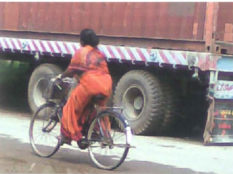
Una mujer bicicletea junto a un camión en el lado sin pavimentar.

El patriarcado: el patriarcado es un concepto global que influye en las relaciones de poder locales y en las culturas. Por consiguiente, se relaciona directamente con la división sexual del trabajo en las sociedades modernas y tradicionales, con la unidad del hogar (o familia) como el perpetuador central de este sistema social. Los hombres, en su posición de poder superior dentro de la jerarquía familiar, tienden a apropiarse de los medios más eficientes de transporte. En esta situación, los autos, las motos, las bicicletas o los vehículos tirados por animales son vistos principalmente como activos de los