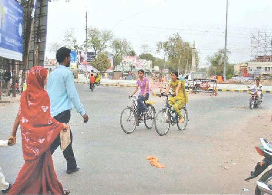
Ciclistas y ciclismo alrededor del mundo

Niñas bicicleando en Alwar en una intersección peligrosa. Ellas prefieren montar bicicleta antes que someterse al acoso del mal transporte público.