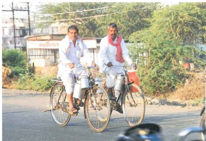
Imágenes de los ciclistas en la India, entregando muebles, querosene y leche.

la facilidad de uso y el hecho de no requerir licencia ni combustible, son factores que convierten a la bicicleta en un modo atractivo para los viajes de los estudiantes. El estacionamiento, la seguridad y la facilidad de los viajes son algunos de los factores más importantes que parecen regir el uso de la bicicleta por parte de mujeres. Una de las razones de la escasa participación de los viajes en bicicleta en las grandes ciudades es la presencia de condiciones hostiles para los ciclistas.