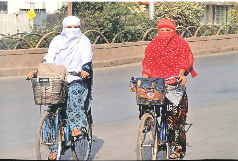
Chicas que van al colegio en bicicleta en una pequeña ciudad de Raipur (se cubren el rostro para protegerse del sol y la contaminación).

La mayoría de las ciudades grandes y medianas de la India tienen cerca de 56% a 72% de viajes, que son viajes cortos (de menos de 5 km), lo que ofrece un enorme potencial para el uso de la bicicleta. La cercanía de las instituciones académicas (mayormente 3-4 km),