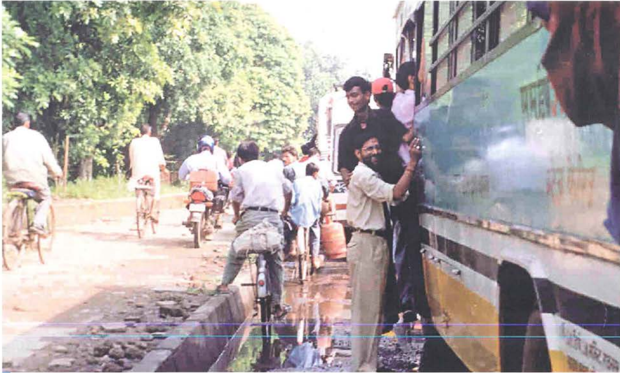
Conflicto en el carril de la izquierda (lento) de la pista.

Es más, la bicicleta no es siempre es la de dos ruedas. A menudo se adapta con 3 o 4 ruedas para el transporte de pasajeros, para transportar mercancías, o para vender cosas. Una bicicleta es no solo un medio de transporte para acceder a los medios de vida; es un medio de vida por sí mismo.