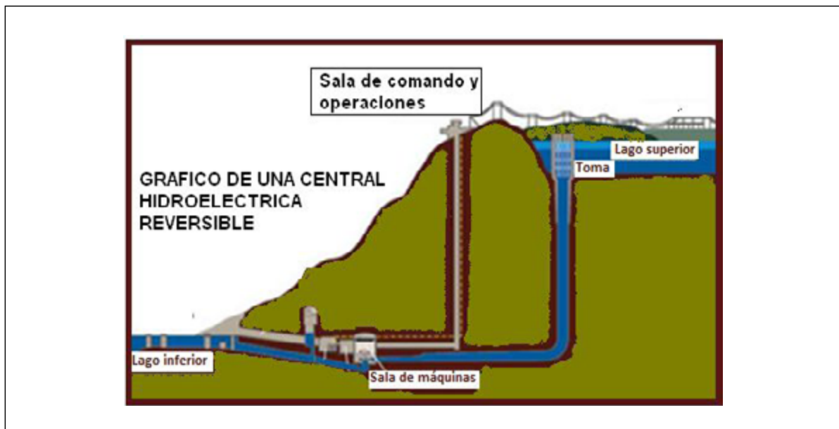
FIGURA 2. Central hidroeléctrica reversible

Aplicando la tecnología SIG (Sistemas de Información Geográfica). Sobre la base digital geográfica básica de nuestro país, se le superpuso la capa de información digital sobre centrales hidroeléctricas. Se seleccionaron aquellas centrales hidroeléctricas que dispusieron de dos embalses separados en cota altimétrica. Además, dentro de ellos se seleccionaron aquellos sistemas de dos embalses con turbinas reversibles. De este modo se seleccionaron dos sistemas hidroeléctricos que disponen de turbinas reversibles con dos embalses.