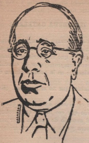
Don Manuel Azaña, Ministro de la Guerra

la hora en que por no ejercer la labor complementaria a que aludía, habéis hecho una maravillosa e increíble, fabulosa, legendaria reforma