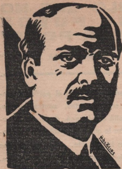
Don José Ortega y Gasset, Prominente figura en las Cáma- ras Constituyentes.

Ahora nada humano, y por tanto español, es ajeno a las inquietudes de su corazón, henchido de amor, y con el loable desinterés, ofrece trabajar como obrero, en la edificación de la ciudad futura.