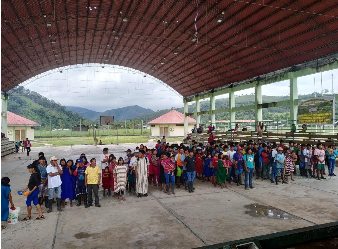
Imagen 2: Nativos ashéninka esperando la repartición del masato.