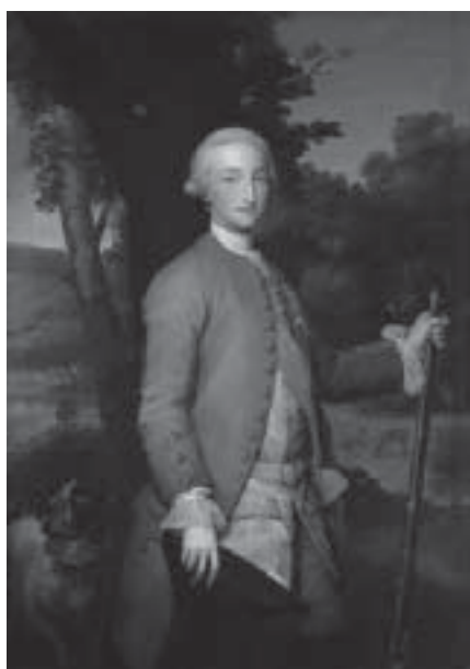
Fig. 7. Carlos IV, príncipe de Asturias, pintado por Mengs en 1765, con motivo de la boda (Benezit, 1966 Tomo III p.248)