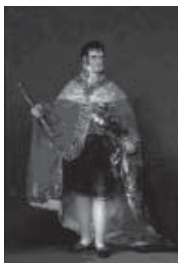
Fig. 13. Fernando VII por Goya (Museo del Prado).