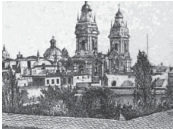
Fig. 4. Patio interior del palacio virreinal. La cúpula de la capilla está oculta por el árbol.