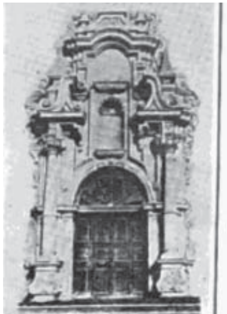
Fig. 2. Frontispicio de la capilla de Palacio.