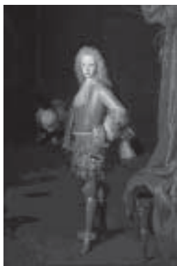
Fig. 6. Luis I, príncipe de Asturias, por Houasse (Museo del Prado).