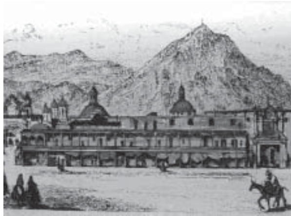
Fig. 3. La cúpula del centro. Capilla de palacio (Siglo XIX).