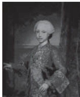
Fig. 11. Infante Xavier de Borbón y Sajonia, por Mengs (Museo del Prado).