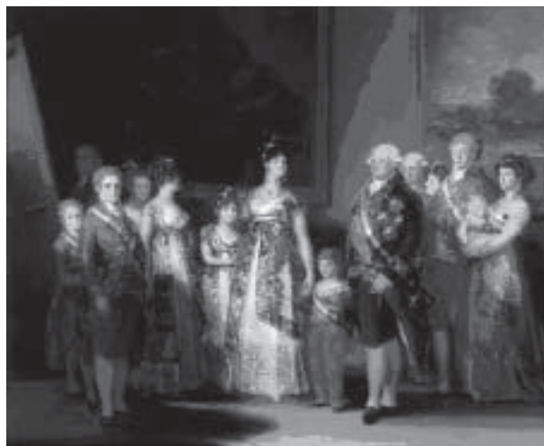
Fig. 12. La familia de Carlos IV por Goya (Museo del Prado). De izquierda a derecha: el infante don Carlos María Isidro, Fernando Príncipe de Asturias, la infanta doña Pepa, María Josefa (hija de Carlos III), la infanta Carlota Joaquina, la infanta María Isabel, la Reina, el infante Francisco de Paula, el Rey, el infante Antonio Pascual (hijo de Carlos III), la infanta María Amalia, el Rey Luis I de Etruria y su esposa, la infanta María Luisa y su hijo en brazos.