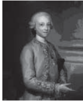
Fig. 9. Infante Gabriel de Borbón y Sajonia, por Mengs (Museo del Prado).