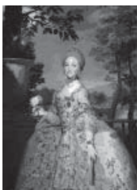
Fig. 8. María Luisa de Parma, princesa de Asturias, pintado por Mengs en 1765, con motivo de la boda (Benezit, ibíd.).