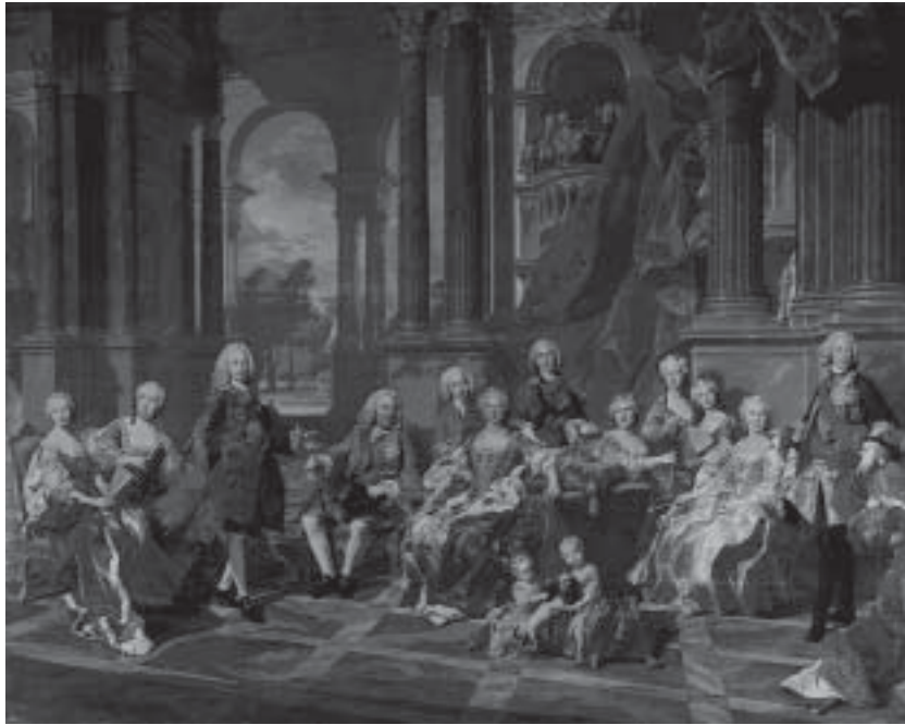
Fig. 5. La Familia de Felipe V. Cuadro de van Loo, de 1743 (Museo del Prado). Reúne de manera imaginaria a toda la descendencia del monarca. De izquierda a derecha: la infanta Mariana Victoria Reina de Portugal, Bárbara de Braganza, princesa de Asturias y su esposo, Fernando príncipe de Asturias, el infante cardenal Luis, Isabel Farnesio, Reina de España, Felipe Duque de Parma y su esposa Luisa de Francia; la infanta María Teresa Delfina de Francia, la infanta María Antonia Reina de Cerdeña, María Amalia de Sajonia y su esposo Carlos Rey de las Dos Sicilias. En el suelo, jugando con un perrito, María Luisa, hija del Duque de Parma y futura esposa de Carlos IV de España, y María Isabel, hija del Rey de las