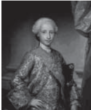
Fig. 10. Infante Antonio Pascual de Borbón y Sajonia, por Mengs (Museo del Prado).