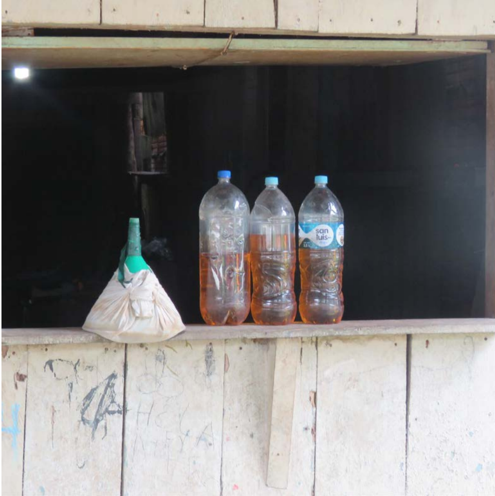
Fotografía de una casa que ofrecía por su ventana gasolina embotellada.

Al lado de la ventana hay un cartel que anuncia la venta de gasolina atrayendo a los interesados. Conforme pasó el tiempo, me fuí dando cuenta que se trataría de una práctica muy común que, aunque nunca logré determinar de dónde sacaban la gasolina, algunos me dijeron que existen trabajadores de la empresa que la robaban para venderla “acá” (Villa Trompeteros), otros me dijeron que la traen de “afuera” y la reparten en botellas por galones porque así “sacan más”.