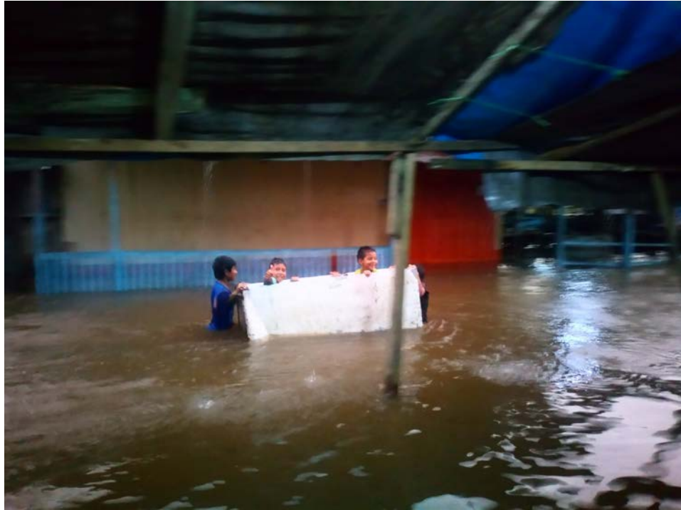
Fotografía de unos niños navegando en un refrigerador en Villa Trompeteros después de la subida del río corrientes.

En lo que realizaba mi trabajo de campo en la comunidad San Cristóbal, las fuertes lluvias no cesaron generando la subida del río. Al regresar a Villa Trompeteros, el agua había avanzado hasta inundar los primeros puestos del mercado y día a día siguió subiendo, hasta el punto que, días antes de irme, saliendo del hospedaje de Miguel mojado hasta el ombligo, me topo con estos muchachos utilizándola para navegar por la inundación de las calles, un re-aprovechamiento que le imprime al objeto una nueva finalidad.