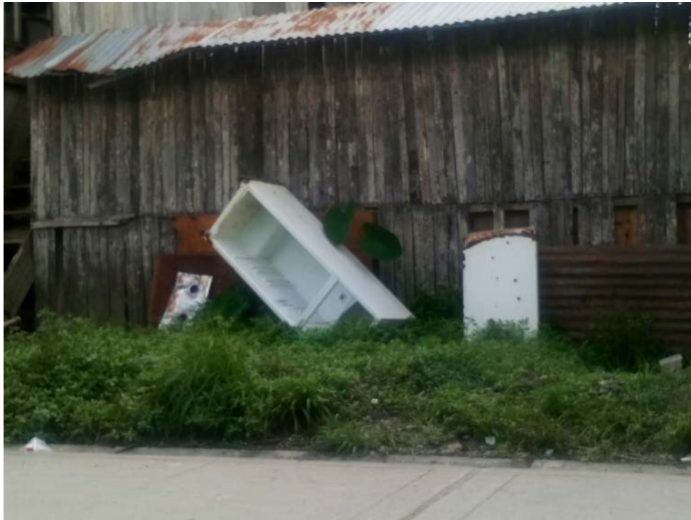
Fotografía tomada los primeros días de mi estadía en Villa Trompeteros.

objeto roto como, por ejemplo, reparar la pata rota de una silla. Sin embargo, existen ejemplos que no encajan con ninguna de las categorías de re-aprovechamiento señaladas por el PLANRES 2016-2024 (Ministerio del Ambiente, 2016), como lo es el caso de los refrigeradores y congeladores abandonados a la intemperie en distintas partes de Villa Trompeteros.