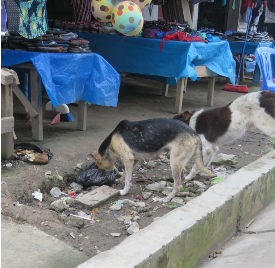
Fotografía tomada saliendo del mercado de Villa Trompeteros.

Por su lado, en la comunidad San Cristóbal, la disposición de basura es totalmente distinta. Al tratarse de una comunidad mucho más pequeña con muy poco movimiento comercial, la generación en sí de basura es diferente. No hay grandes concentraciones de basura en un punto específico de la comunidad, sino que la generación es doméstica y, en cada hogar, existe un lugar designado para su disposición. En la mayoría de casas se designaba un espacio en los límites del territorio del hogar para disponer los desechos del día. En este espacio al borde de la vivienda y prudentemente alejado se instalaba el silo y un punto de acopio donde se arrojaban los residuos del día a día, acumulándose. Al preguntar a las personas si existía algún procedimiento de recojo municipal de recojo de basura algunas amas de casa me respondieron “Lo arrojamos ahí no más, todo, por el barranquito”.