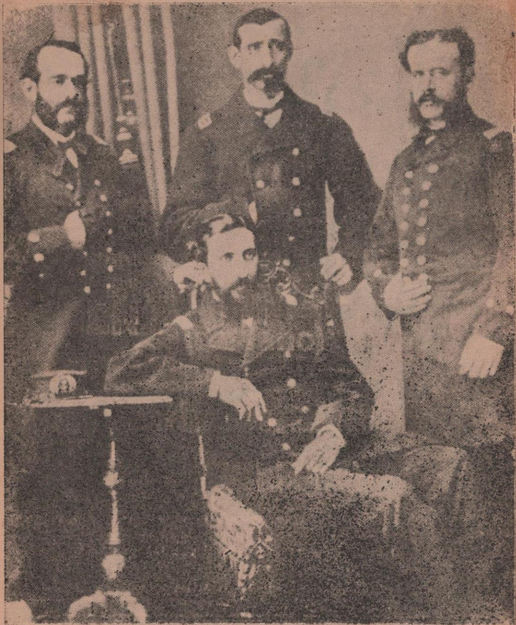
La campaña marítima, durante la guerra con Chile fue sostenida valerosamente por los cuatro marinos de esta antigua foto. De izquierda a derecha don Miguel Grau, Lizardo Montero, Aurelio García y García, y Carlos Ferreyros.