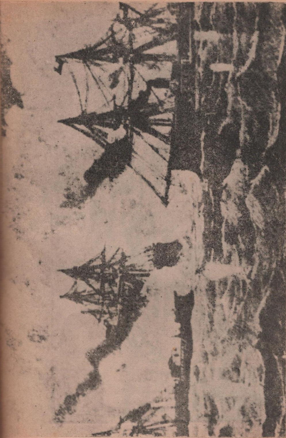
El combate de Punta Angamos, entre el monitor "Huáscar" y los acorazados chilenos Cochrane y Blanco Encalada. Lejos, otras unidades de la escuadra enemiga. (Pintura al óleo de autor anónimo. Reproducción de una fotografía de la colección del señor Jorge Rengifo Fowler).