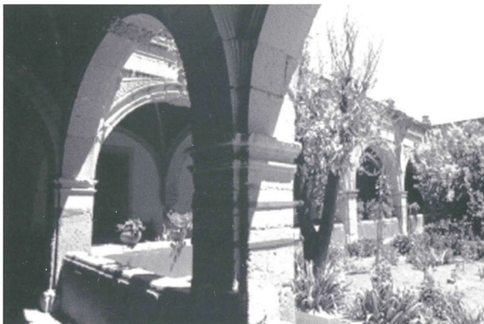
Patio principal construido por Baltazar López en 1734