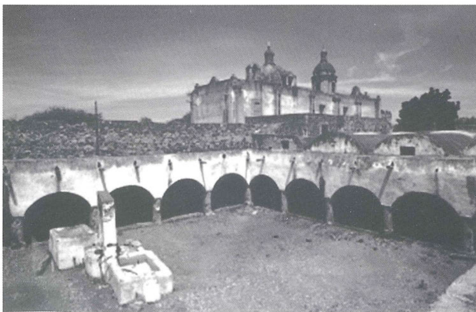
Patio primitivo construido por el administrador Ignacio Enríquez en 1713