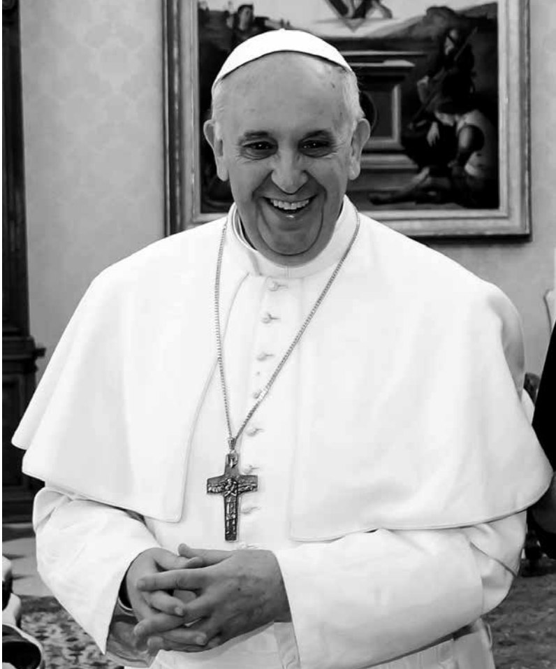
Retrato del papa Francisco.

Fue el cardenal Bergoglio quien acogió el pedido de los deudos y autorizó que los restos de las mujeres secuestradas fueran sepultados en