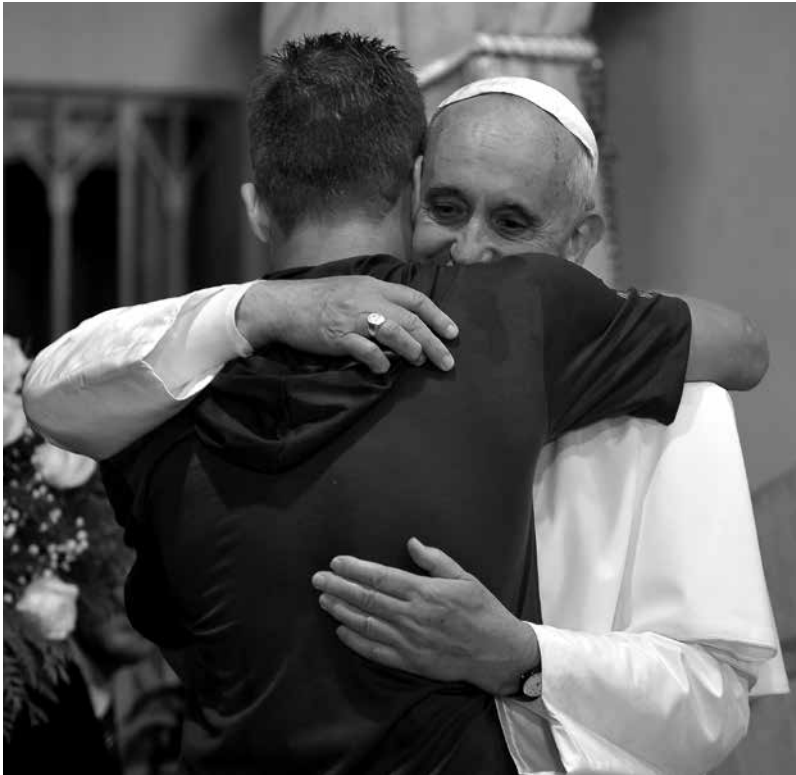
Un feligrés abraza espontáneamente al papa Francisco durante la Jornada Mundial de la Juventud 2013 realizada en Brasil.

La noche de la misa de clausura, el papa Francisco emprende su viaje de regreso. Su primer recorrido en Roma lo lleva nuevamente a la Basílica de Santa Maria Maggiore, una escala en la ruta del aeropuerto al Vaticano. Francisco reza en silencio ante la imagen de la Virgen Salus Populi Romani. Deposita un balón de fútbol y una camiseta a modo de ofrendas en el altar. Regalos de jóvenes a un papa apasionado por el fútbol.