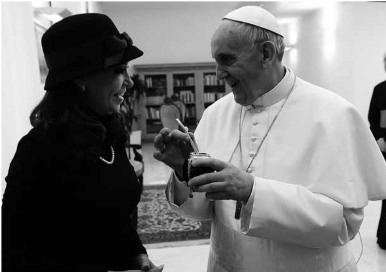
La presidenta argentina Cristina Fernández de Kirchner toma mate con el papa Francisco.

Sin embargo, las expectativas de un cambio muy rápido son amortiguadas por el propio Francisco. «La reforma de la curia es algo muy serio», declara a pocos días de instalado el consejo. «Creo que vamos a tener que hacer dos o tres reuniones más hasta que se note la reforma». Los temas tratados no serían solo los escándalos suscitados por los vatileaks , «que todo el mundo conoce»; la Iglesia tendría que reformarse constantemente; sino, se quedaría atrás. «Así, la Iglesia es dinámica y responde a las cosas». Según Francisco, hay cosas que servían para el siglo pasado y que ahora tienen que reacomodarse.