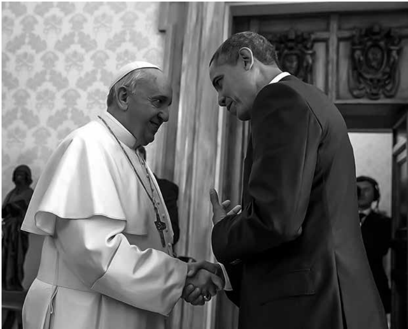
Barack Obama, presidente de los EE.UU., saluda al papa Francisco en su visita al Vaticano el 27 de marzo de 2014.

El IOR tiene que cambiar, entonces. ¿Pero cómo? Uno de los asesores papales más cercanos, el cardenal hondureño Oscar Andrés Rodríguez Maradiaga, sostiene en una entrevista con la cadena de televisión italiana RAI1: «Todo Estado tiene derecho a tener un banco. ¿Por qué no el Vaticano? Pero tiene que ser de otra manera. Sería muy buena idea hacer