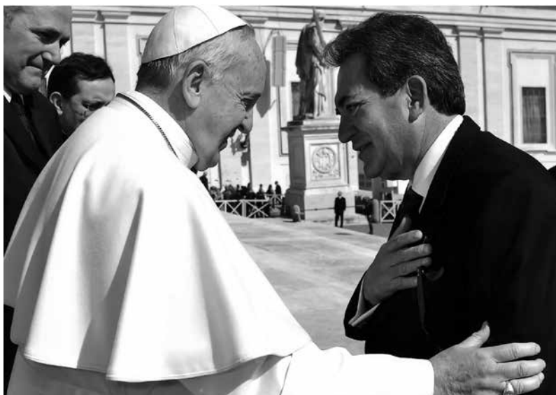
Carlos Lozano de la Torre, gobernador del Estado de Aguascalientes, México, rinde respetos al papa Francisco en su visita al Vaticano.

El Universal , sus declaraciones acerca del celibato causaron un revuelo. «El celibato no es un dogma de la Iglesia y se puede discutir porque es una tradición eclesial». El secretario de Estado vaticano designado aludió a la escasez del clero que existiría en muchas partes y advirtió que había que tener «apertura a los signos de los tiempos». La Iglesia requeriría reformas pero orientadas a los principios fundacionales del cristianismo, desarrolló la idea Parolin un mes antes de asumir su nuevo cargo oficialmente. Sus declaraciones fueron interpretadas como una cauta apertura de la Iglesia oficial, que hasta entonces se había mostrado inflexible en torno a este tema.