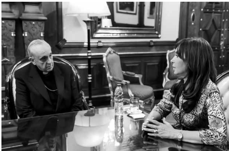
Jorge Mario Bergoglio con Cristina Fernández de Kirchner, cuando todavía era cardenal.