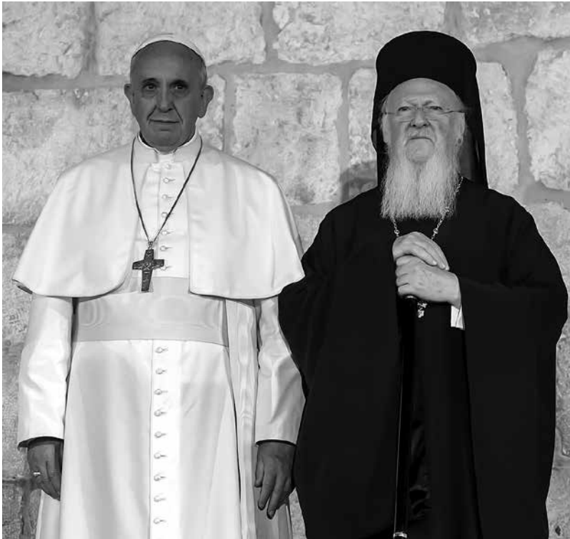
Papa Francisco y patriarca Bartolomé I de Constantinopla en la iglesia del Santo Sepulcro en Jerusalén.

Cuando el papa Francisco llamó a sus amigos Figueroa y Skorka a los pocos días de haber sido elegido papa, ambos le recordaron que aún tenían pendiente la grabación del último programa de la serie Biblia, diálogo vigente . Cuándo se hará esta grabación, señalan Figueroa y Skorka, es todavía incierto. Sin embargo, a la pregunta de ambos si recordaba cuál era el tema acordado, el papa Francisco responde en el acto: «Sí, la amistad».