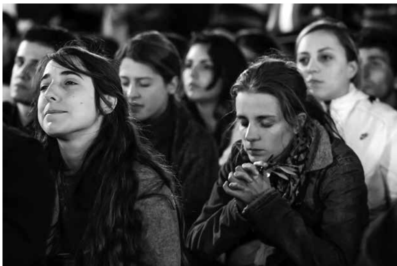
Fieles siguen en Plaza de Mayo la Santa Misa en Roma.

Luego de almorzar juntos en la residencia de verano, Francisco vuela de regreso al Vaticano.