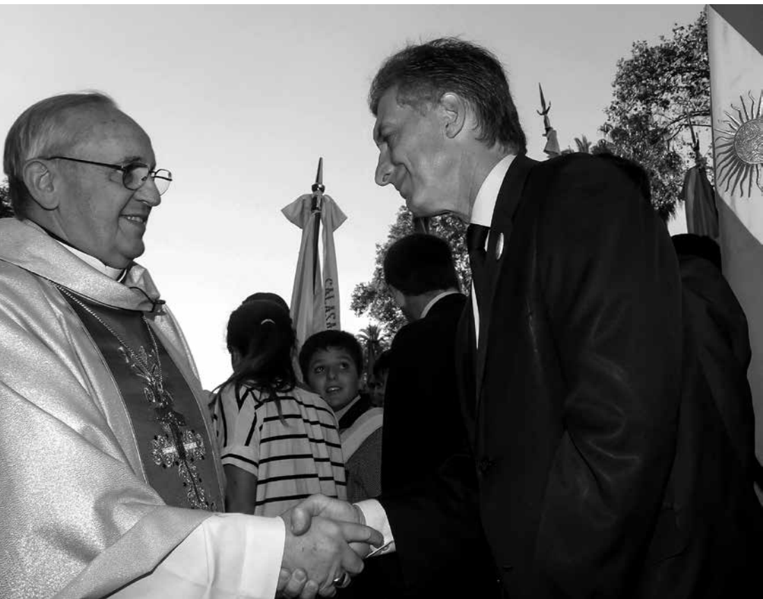
Jorge Mario Bergoglio, aún cardenal de Buenos Aires, estrecha la mano del político argentino Mauricio Macri en la misa anual por la educación. 18 de abril de 2012.