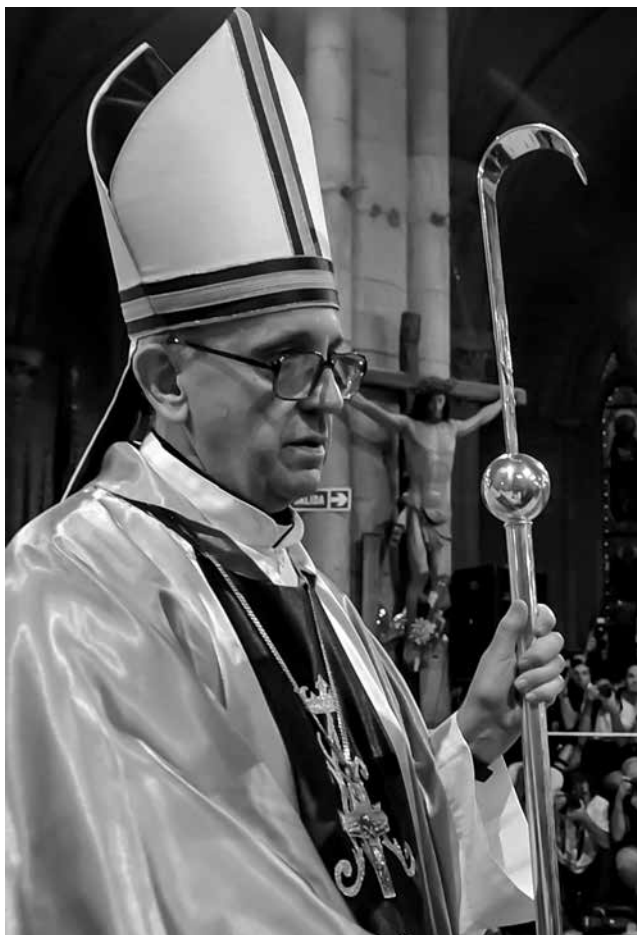
El cardenal Jorge Mario Bergoglio, antes de ser elegido papa, celebra la misa conmemorativa del año 2008.

enterarse de lo que sucedía al interior de la institución. El sociólogo puntualiza: «Con su silencio, Bergoglio se hizo culpable. Que se haya convertido en papa me ha puesto muy triste». Fortunato Mallimaci exige a la Iglesia Católica y al papa Francisco que se abran los archivos de la