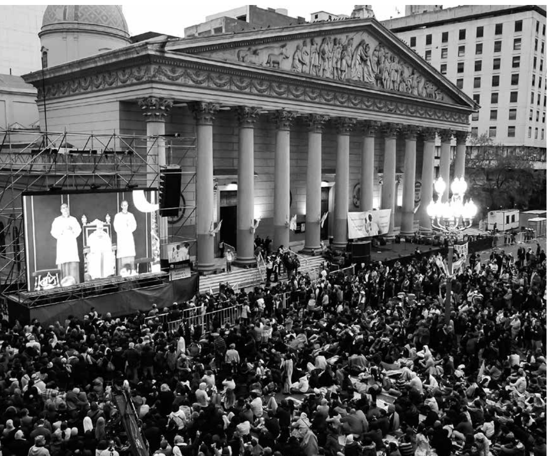
Francisco es un papa popular, como lo demuestran los fieles argentinos reunidos en la Plaza de Mayo para verlo oficiar la Santa Misa en pantalla gigante.