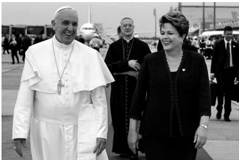
Llegada del papa Francisco a la Base Aérea do Galeão en Brasil (2013). Lo recibió la presidenta brasileña Dilma Rousseff.