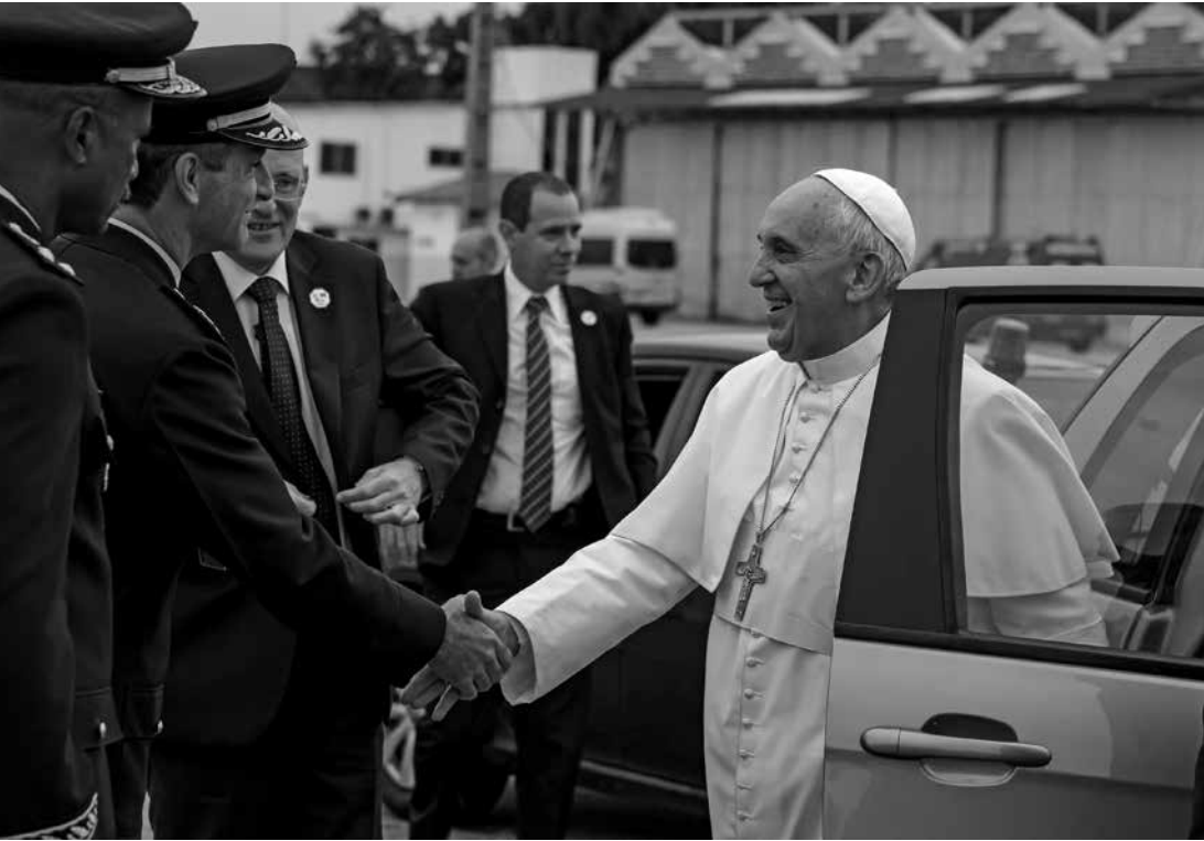
Embarque del papa Francisco en la Base Aérea de Galeão, en Brasil, con rumbo a San José de los Campos (2013).

No quería ahuyentar a los creyentes con un trasero desnudo, añade; después de todo, él vive de donaciones voluntarias. Sin embargo, la gente que viene a pasear aquí este día no tendría una mente tan estrecha. Recompensa la fantasía y la destreza manual del escultor en dinero contante y sonante.