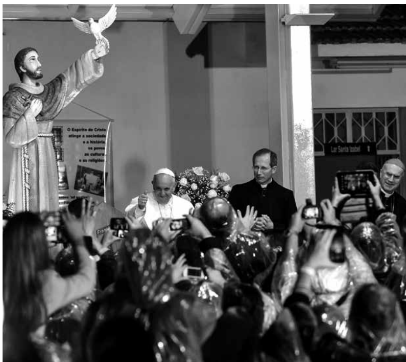
El papa Francisco participa de la inauguración del Centro de Atención a Dependientes Químicos del Hospital San Francisco, en Río de Janeiro, Brasil (25 de julio de 2013).

Francisco pide comprensión y compasión para los drogadictos y firmeza contra «los mercaderes de la muerte, que siguen la lógica del poder y el dinero a toda costa». «La plaga del narcotráfico, que favorece la violencia y siembra dolor y muerte, requiere un acto de valor de toda la sociedad». Rechaza la liberalización del consumo de drogas, que se estaría discutiendo en varias partes de América Latina y sería un método equivocado. Subraya la necesidad de afrontar los problemas que están en la base del consumo de drogas «promoviendo una mayor justicia».