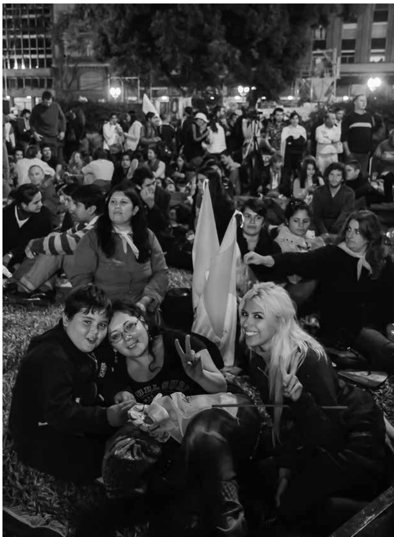
Los jóvenes argentinos esperan la entronización de Bergoglio, figura popular entre la juventud, como papa.