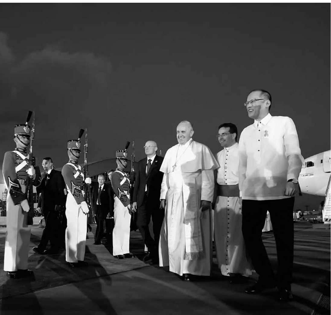
Visita del papa Francisco a Filipinas el 15 de enero de 2015. En la imagen aparece con el presidente filipino, Benigno Simeón Aquino III.