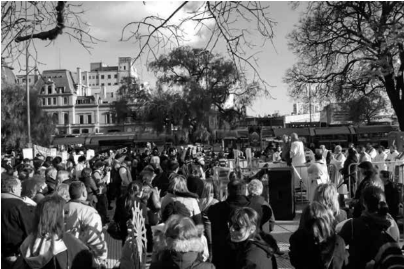
Oficiando una misa en la Plaza de la Constitución.

Un esplendoroso cielo azul le da la bienvenida al viajero y un suave viento lo invita a llenar sus pulmones de aire fresco, lejos de los gases tóxicos de la gran ciudad. De las copas de empinadas palmeras emergen unos chillidos penetrantes. Pequeños loros verdes elevan el vuelo incansables desde las tupidas hojas de las palmeras, solo para volverse a posar sobre ellas al poco rato.