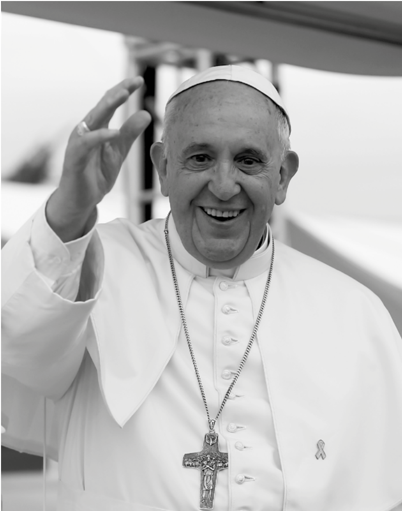
Retrato del papa Francisco en su visita pastoral a Corea del Sur. La foto corresponde al 17 de agosto, Día de la Juventud en Asia.