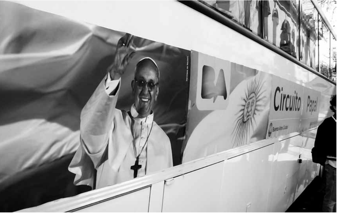
Uno de los buses que realizan los «Papatours» en la ciudad de Buenos Aires.

En los casi nueve años que viví en Argentina como corresponsal libre para Sudamérica, las noticias que provenían de la casa de gobierno en la Plaza de Mayo con frecuencia opacaban las que se recibían del arzobispado de Buenos Aires. El cardenal Jorge Mario Bergoglio evitaba a la prensa y no concedía entrevistas. De ahí que su trabajo diario muchas veces pasara desapercibido y no suscitara comentarios de nuestra parte, es decir, de los corresponsales extranjeros —hasta el 13 de marzo de 2013—. Es como si de pronto cada argentino tuviera una anécdota que contar sobre Jorge Mario Bergoglio, y los periodistas agradecen cada historia sobre la vida del nuevo papa. Ha nacido la papamania en Argentina. Desde el canillita y el vendedor de almendras, pasando por el peluquero y el empleado