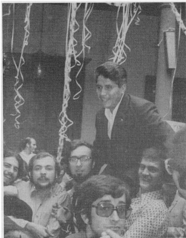
Fili en la tradicional encerrona de Derecho.

Instituto Riva-Agüero Lártiga 459 - Lima 1973