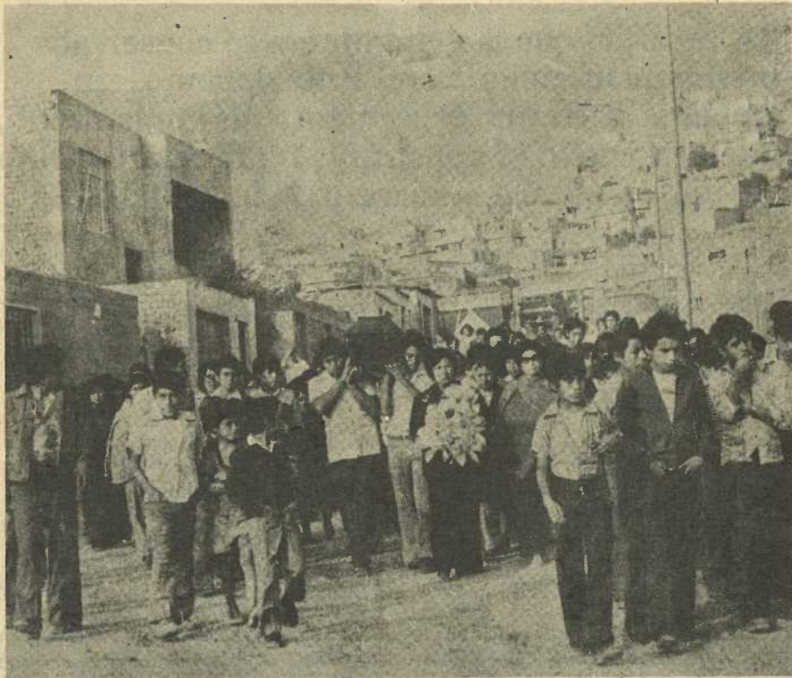
La Iglesia percibe la situación violenta a la que están sometidos los pobres.

ción del "Comité de Defensa y Unificación Sindical" (CDUS) que prepararía el nacimiento de la futura CGTP.