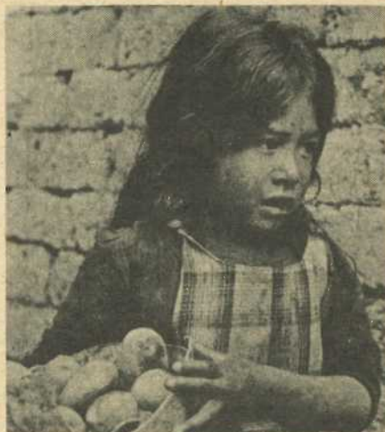
En una época de mucho sufrimiento del pueblo, de intensa movilización y de represión, se gestan iniciativas de solidaridad y apoyo, tanto desde las comunidades de base como desde la jerarquía de la Iglesia.

Desde esa inserción en el pueblo, desde esas comunidades cristianas se han gestado en estos años iniciativas de apoyo y solidaridad de muy diverso tipo: ollas comunes, visitas a presos y familias, colectas, propagandización de problemas obreros a menudo distorsionados o acallados, campañas de firmas para presionar a las autoridades gubernamentales, acogida a huelguistas de hambre luchando por su reposición, etc. La Comisión Episcopal de Acción Social y varios obispos han tomado parte activa especialmente en defensa de los despedidos en una línea de servicio a los derechos del pobre. Hay que señalar también las celebraciones eucarísticas que muchas veces se realizan alrededor de esas ocasiones; ellas cobran una dimensión espiritual especial por ser vividas desde una auténtica experiencia pasional. Todas éstas son expresiones diversas de una iglesia que crece y actúa desde la fe de los pobres. Que se va comprendien-