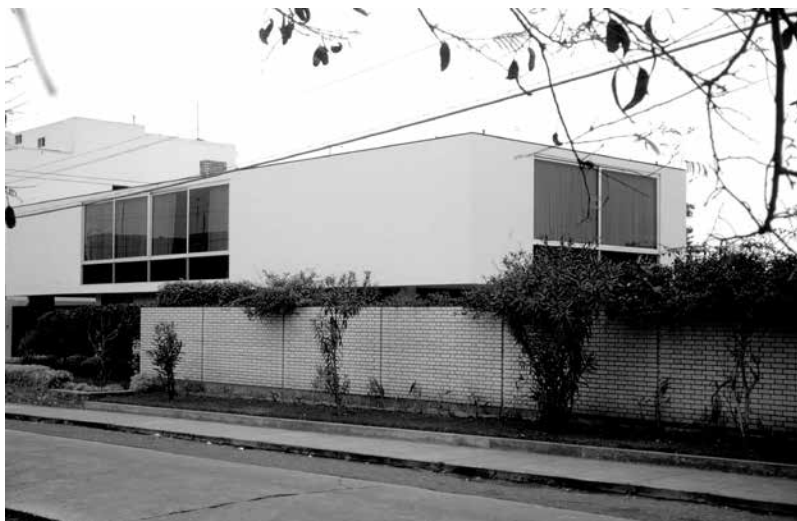
Figura 1. Residencia de NSE alto. Distrito de San Isidro, c. 1985.