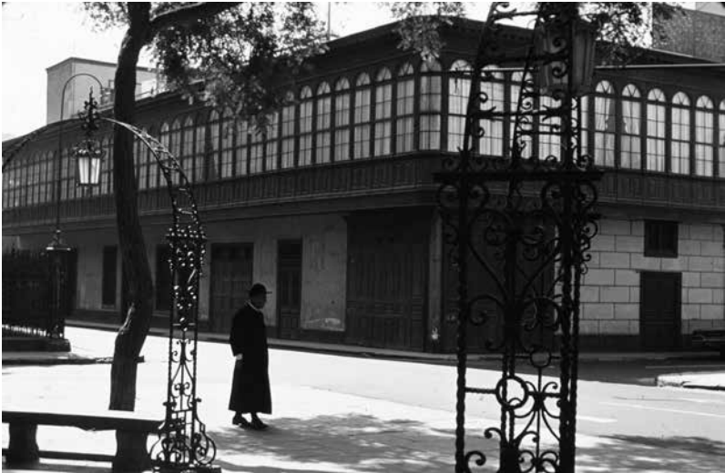
Figura 3. Un rincón escondido en el Cercado de Lima. Viviendas antiguas con balcones tradicionales, c. 1975.