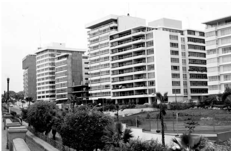
Figura 2. Departamentos de NSE alto con vista al Club de tenis Las Terrazas. Distrito de Miraflores, c. 1995.