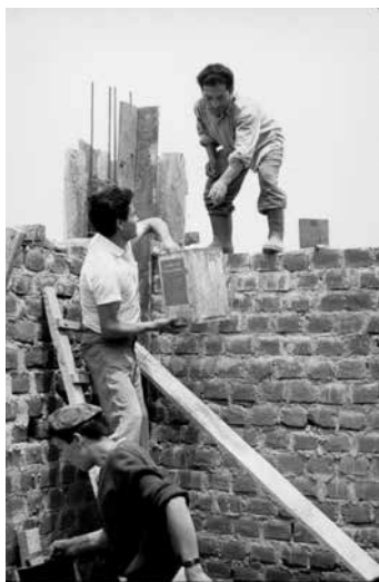
Figura 12. Voluntarios construyen un centro comunal. Pamplona Alta, San Juan de Miraflores, c. 1974.