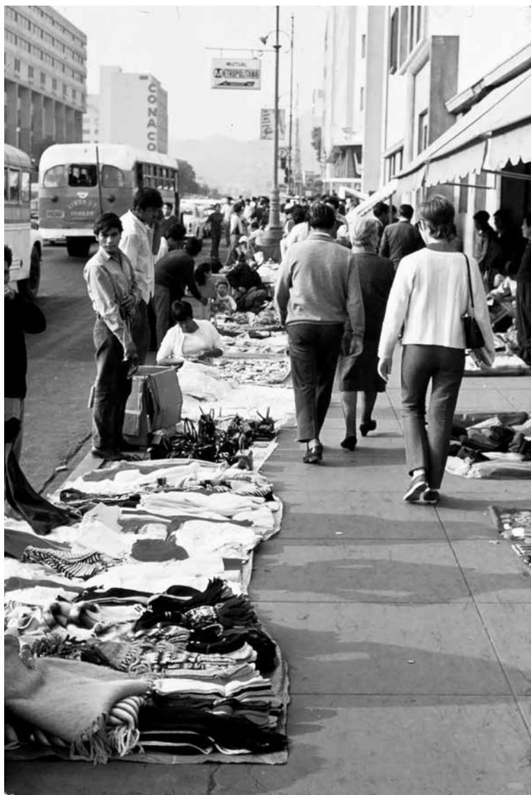
Figura 6. Vendedores ambulantes en la avenida Abancay. Centro de Lima, década de 1970.