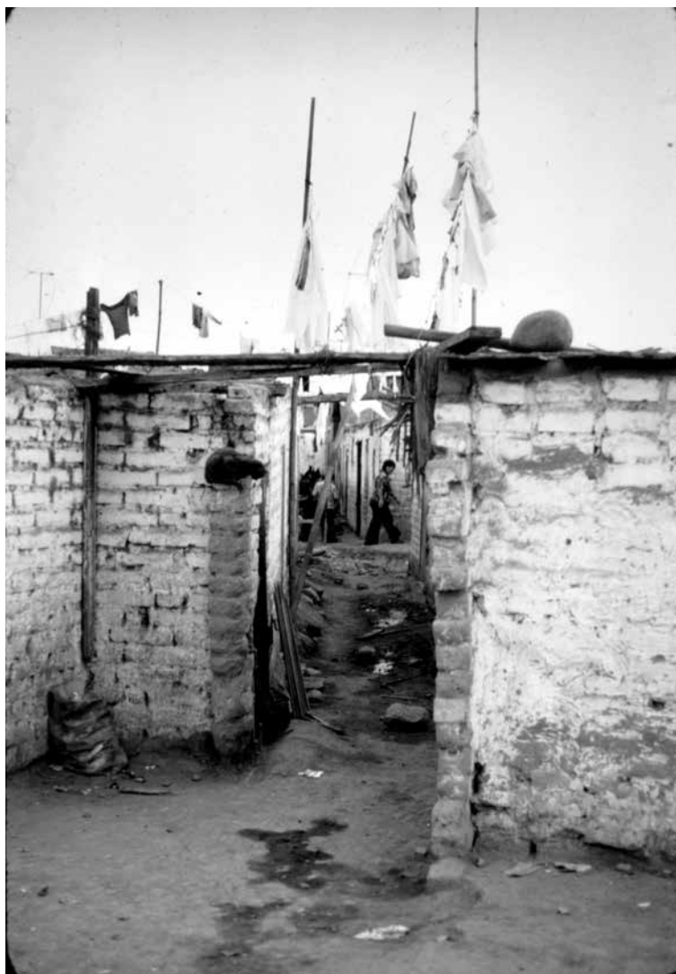
Figura 8. Tugurios arrendados. Casa Huerta, Surquillo, c. 1973.