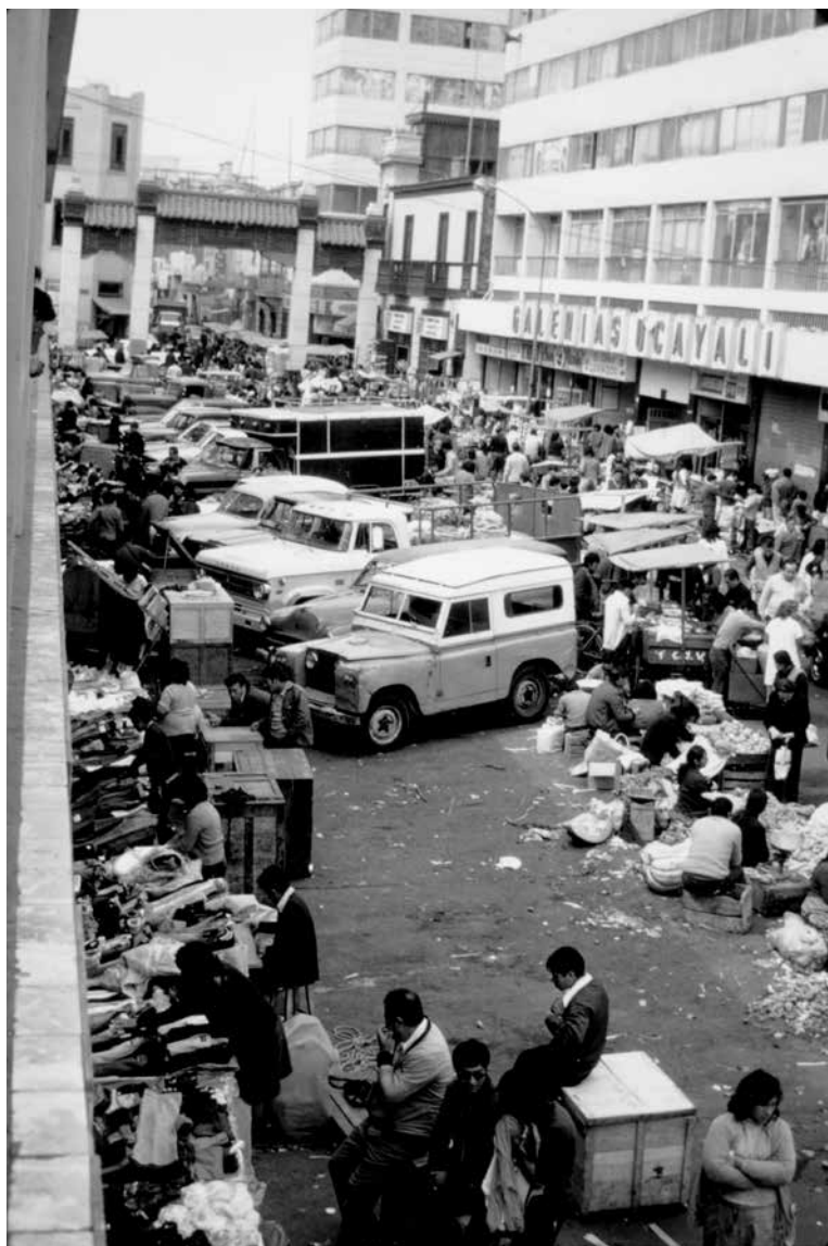
Figura 5. Vendedores ambulantes alrededor del Mercado Central, en el Cercado de Lima. Lima, década de 1980.