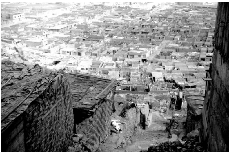
Figura 11. Vista desde el cerro en El Agustino, década de 1980.