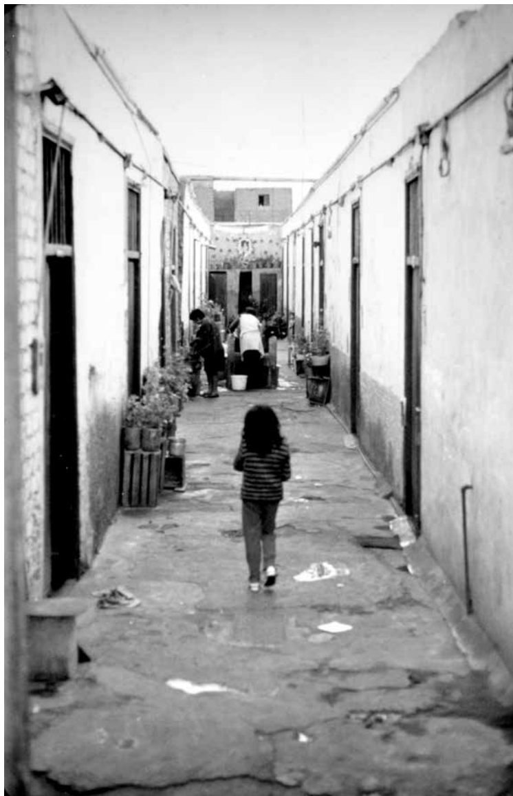
Figura 7. Viviendas arrendadas en La Victoria, década de 1970.