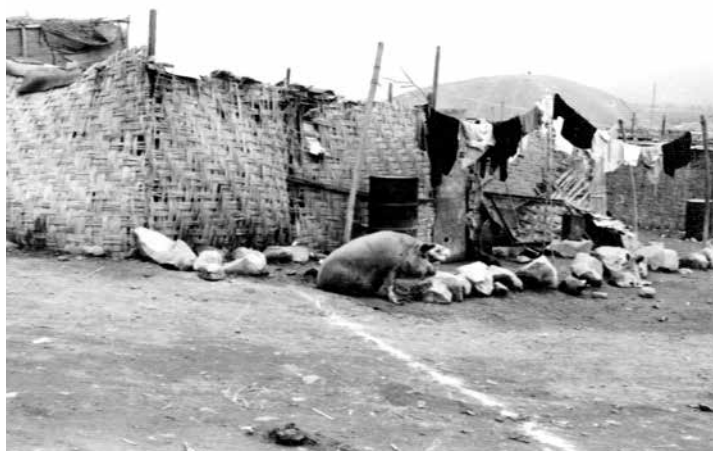
Figura 10. Viviendas de esteras. Pampa de Cuevas, década de 1970.