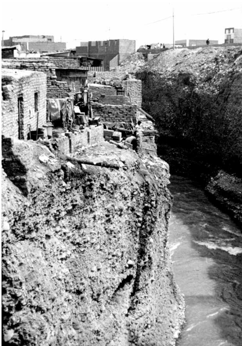
Figura 4. Asentamiento sobre el río Rímac, c. 1983.