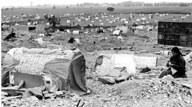
Figura 9. Vista parcial de la invasión de Pamplona, referida en el capítulo 4. Mayo de 1971.