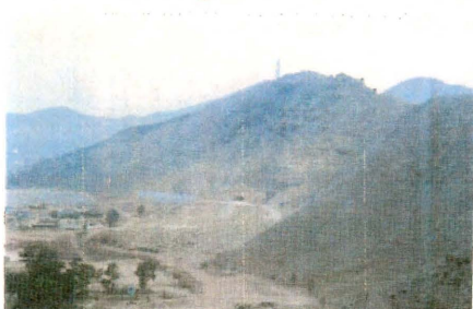
Túnel San Juan de Lurigancho-Rímac