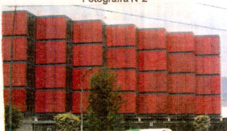
Asociación Cultural Peruano Británica-Sede San Juan de Lurigancho.

El Instituto de Formación Bancaria (IFB) inauguró su sede en el año 2009. Es un edificio de ocho pisos que cuenta con 26 aulas y 8 laboratorios. Está ubicado en la cuadra 8 de la Av. Pirámide del Sol, Urb. Azcarruz, Zárate.