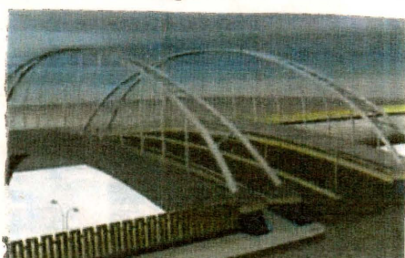
Puente Las Lomas.