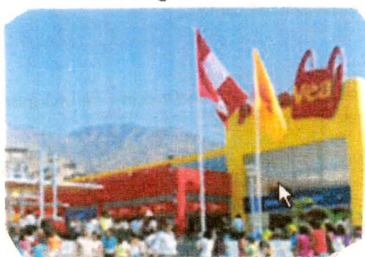
Tienda Plaza Vea - Canto Grande