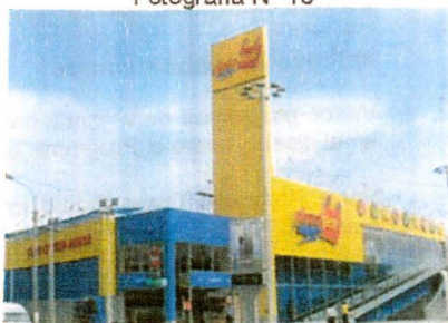
Tienda Plaza Vea - Zárate

En el mes de setiembre de 2010 se inauguró la primera tienda del centro comercial Tottus en el distrito, con una inversión de 3 millones de dólares. El local está ubicado en la cuadra 4 de la Av. Los Tusilagos (a 500 m. de la primera tienda Metro). La infraestructura abarca dos mil metros cuadrados, su construcción demandó 280 puestos de trabajo.