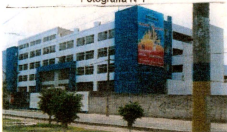
Academia César Vallejo-Aduni Sede San Juan de Lurigancho