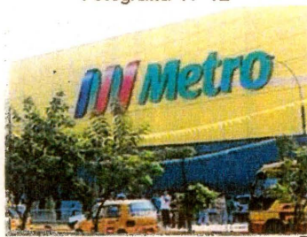
Tienda Comercial Metro

En junio de 2010 abrió sus puertas una tienda comercial Metro, del grupo Cencosud (Chile), la segunda en el distrito. Se ubica en la cuadra 33 de la Av. Próceres de la Independencia. Su construcción representó una inversión superior a los 15 millones de dólares. Posee una extensión de 9 mil m 2 ; tiene 3 niveles. Uno es subterráneo, destinado a playa de estacionamiento con capacidad de hasta 110 vehículos; un primer piso con los principales artículos para el hogar así como electrodomésticos y decoración, y uno segundo en el que se encuentran carnes, librería, juguetería y una pequeña cafetería.