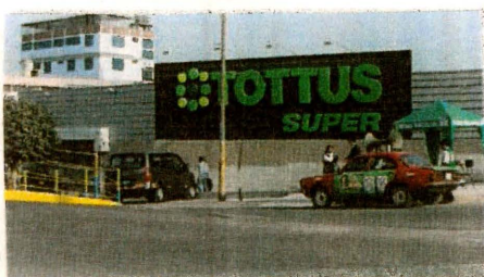
Tienda Comercial TOTTUS-SJL