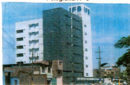
Instituto de Formación Bancaria - Sede San Juan de Lurigancho.