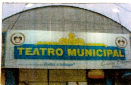
Teatro Municipal de San Juan de Lurigancho Fuente: Equipo Técnico CENCA 2010.