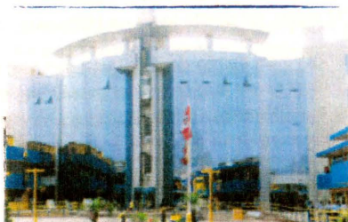
Palacio Municipal del distrito de San Juan de Lurigancho